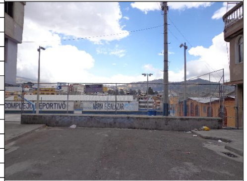
FOTOGRAFÍA DE LA FACHADA