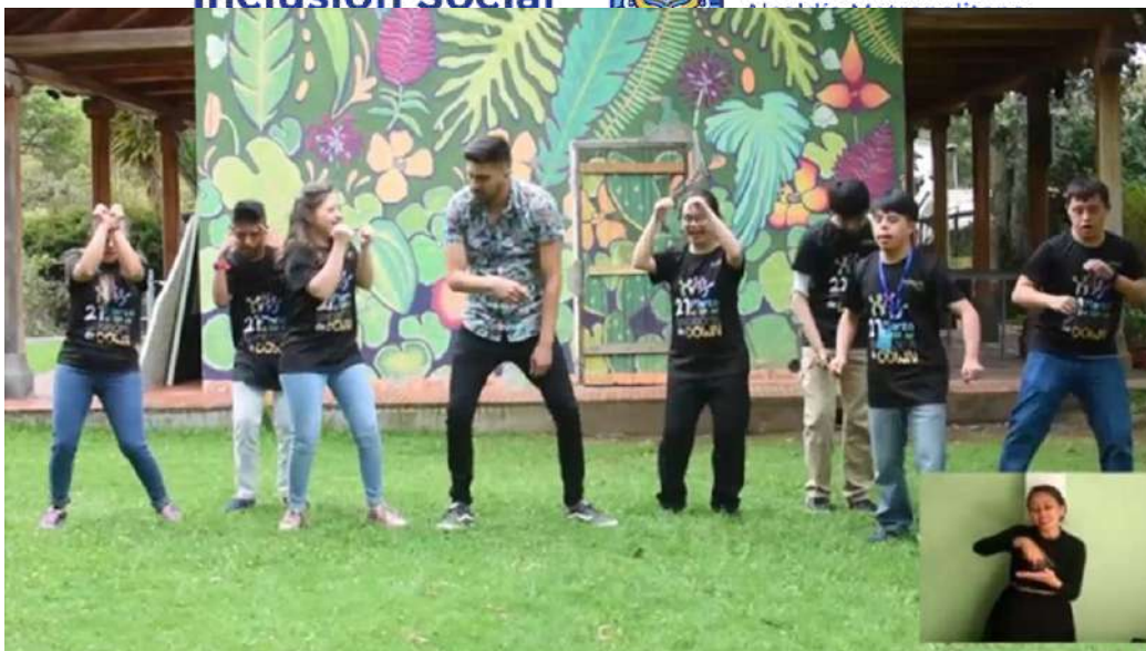
Invitada al día mundial de enfermedades raras