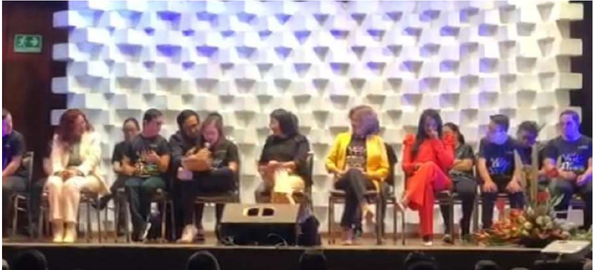
Latidos Down / Ambato - Invitada especial para desfile de moda fashion show