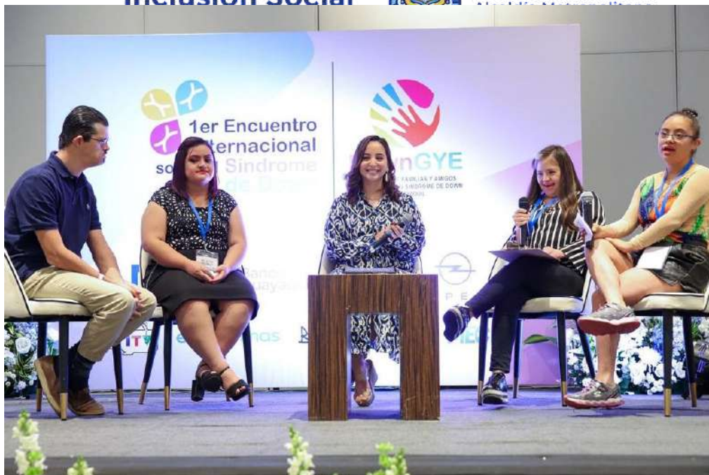
Teatro Capitol - Presentación del cortometraje Down 321