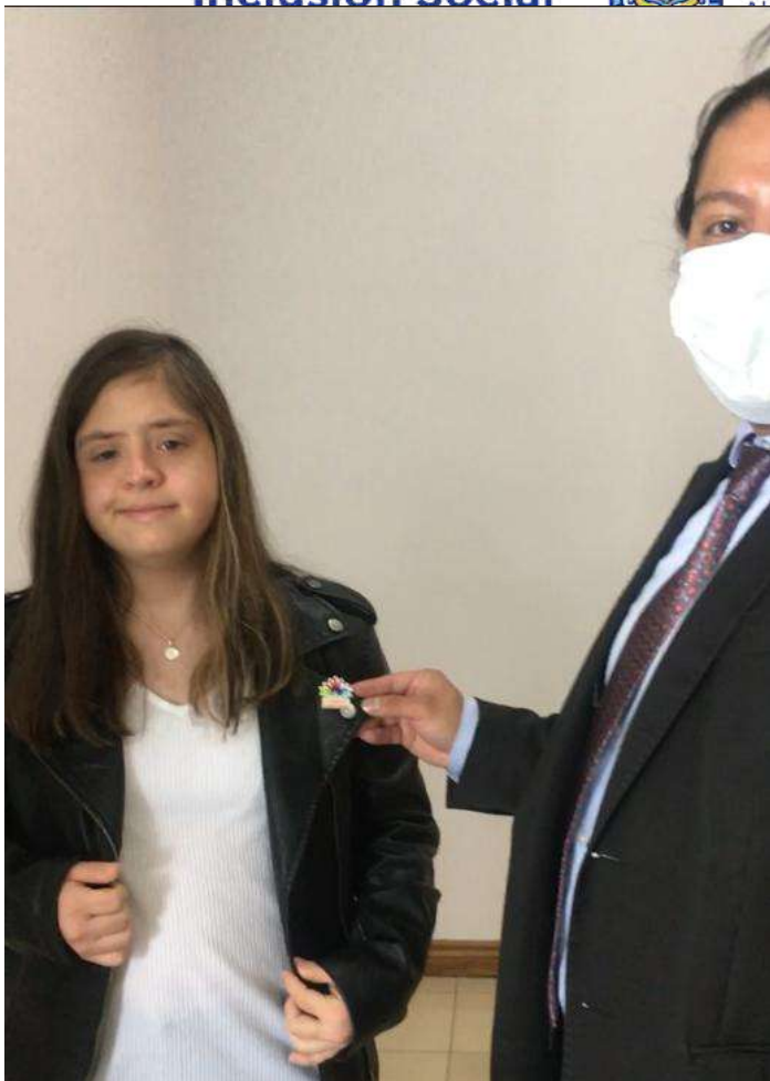
Entrega de reforma a la ley organica de discapacidades