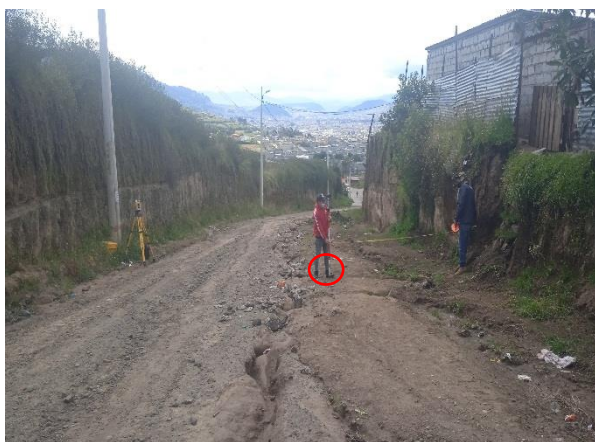
Imagen 1: Eje vial calle Luis García (Oe13D)

1.2.1. Calle Luis García (Oe13D): Una vez que ha sido verificada la información correspondiente al diseño propuesto por la Empresa Pública Metropolitana de Movilidad y Obras Públicas, la Unidad de Territorio y Vivienda de esta Administración procedió a realizar el replanteo del eje de vía de la calle Luis García (Oe13D), en la misma que su sección transversal propuesta mantiene la sección transversal aprobada mediante Concejo Metropolitano de Quito, misma que consta de 12.00 metros de las cuales 9.00 metros corresponden a la calzada y 1.50 metros de acera a cada lado de la vía, sin embargo el diseño propuesto por la Empresa Pública Metropolitana de Movilidad y Obras Públicas de la calle Luis García (Oe13D), no se encuentra proyectado en el espacio existente en sitio, eje que se encuentra desplazado hacia los lotes colindantes a la vía sobre el lindero oriental; razón por la cual se solicita de la manera mas cordial se realice una revisión al diseño vial propuesto.