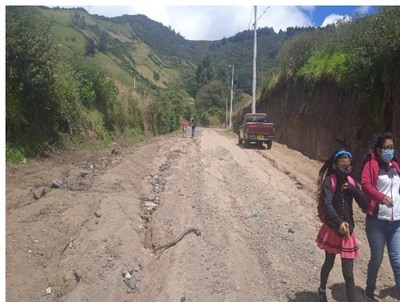
Imagen 2: Eje vial calle Luis García (Oe13D)