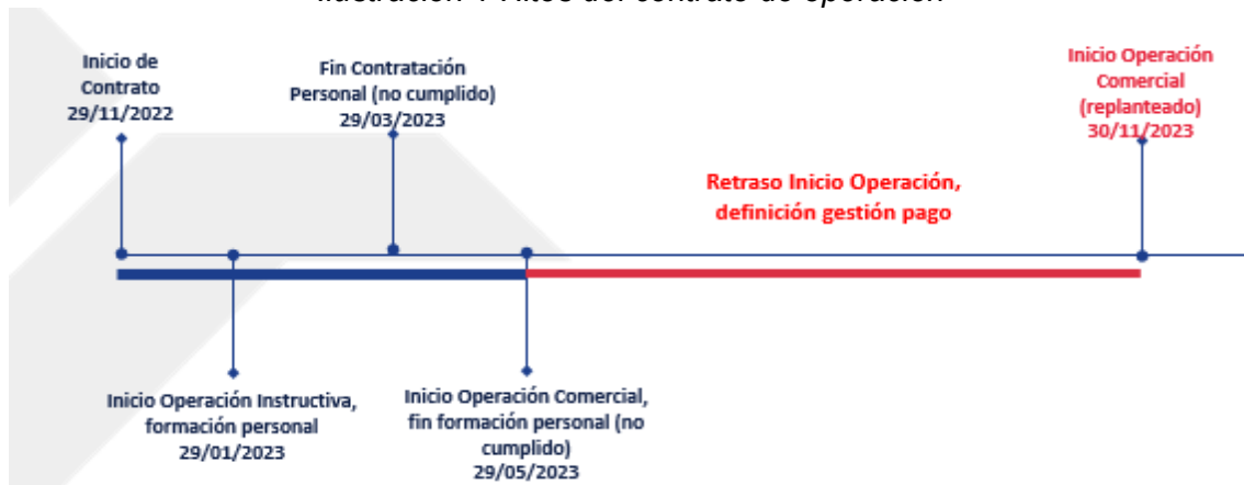
Ilustración 1 Hitos del contrato de operación