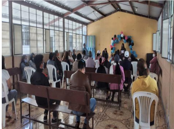
Registro de asistencia