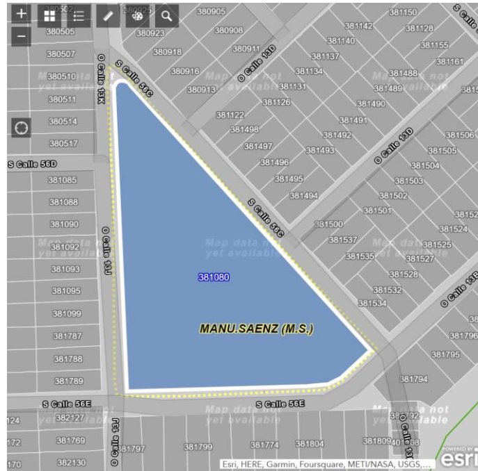
Imagen de Google Maps del predio solicitado