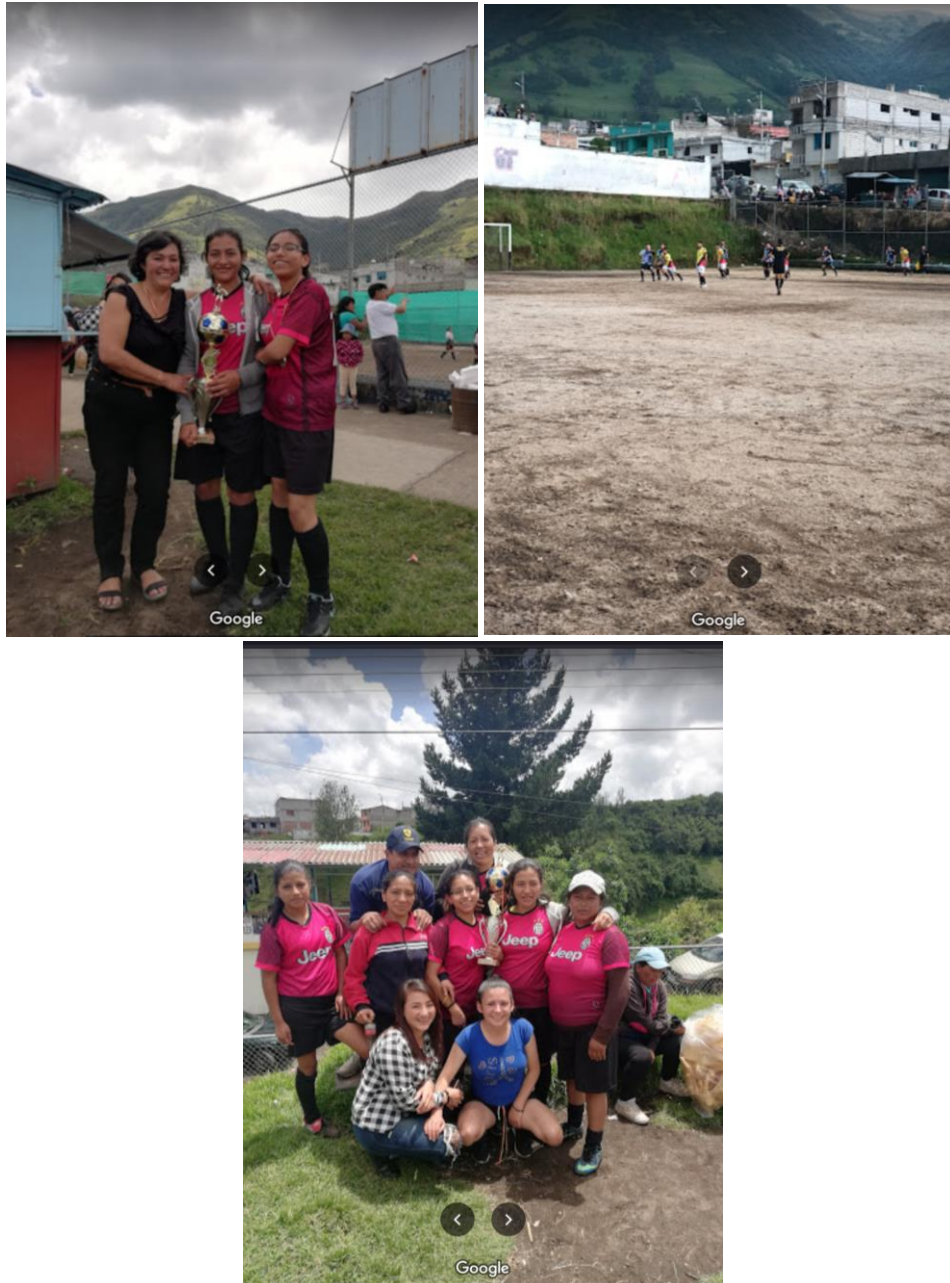
Imágenes de actividades deportivas