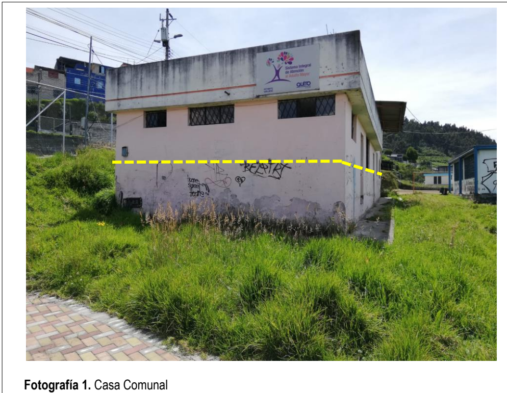
Fotografía 1. Casa Comunal