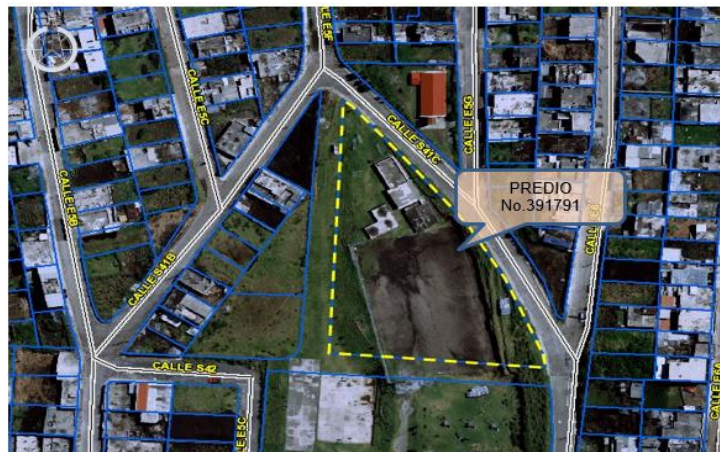
Imagen 1: Sistema Integrado de Registro Catastral de Quito "SIREC-Q"