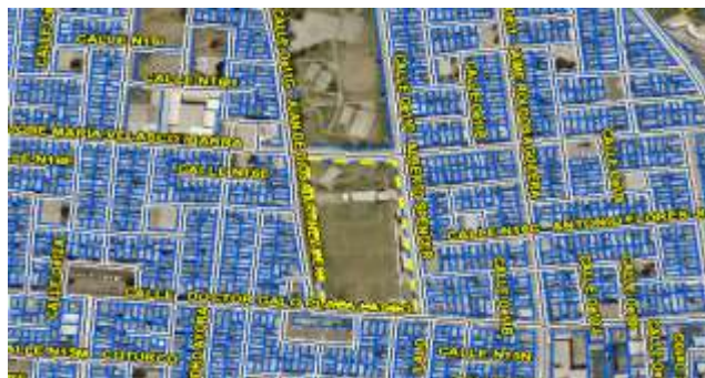
Gráfico No. 1

Zona Metropolitana: CALDERÓN Parroquia: CALDERÓN Barrio/Sector: CARAPUNGO Dependencia administrativa: ADMINISTRACIÓN ZONAL CALDERÓN Uso de suelo: (E) Equipamiento