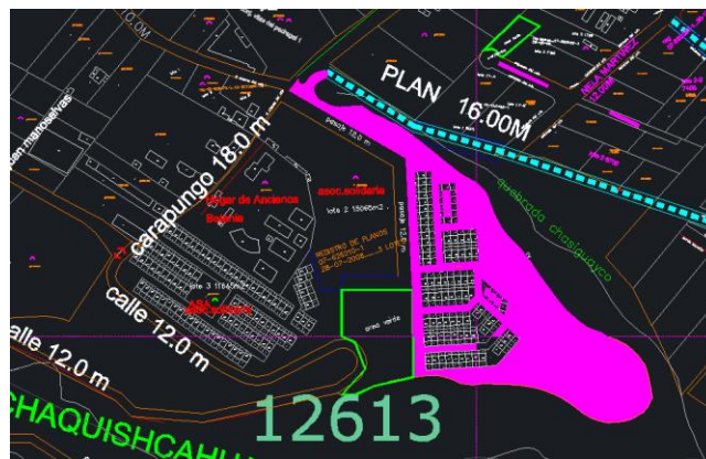
Imagen 6. Vías para predio 1296658

De acuerdo al P.P.C se evidencia que hay vías internas dentro del predio, que no se encuentran aprobadas; las vías de acuerdo al Plano B3C2 del P.P.C; que colindan al predio global y se encuentran aprobadas, es la vía Carapungo de 12,00 metros de ancho.