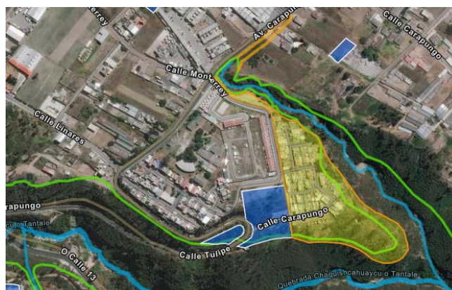
Imagen 7. Predial 1296658