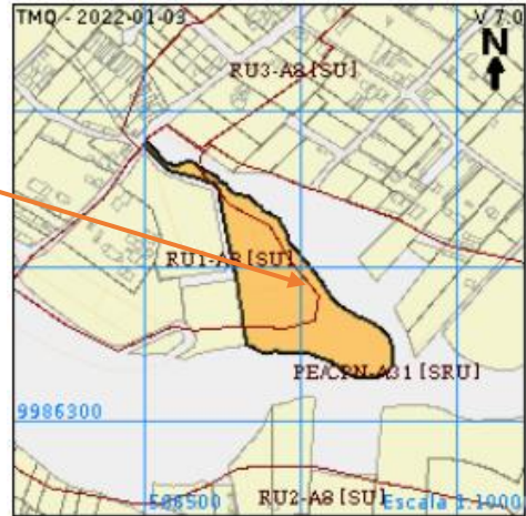
Imagen 2. Grafica Predial 1296658