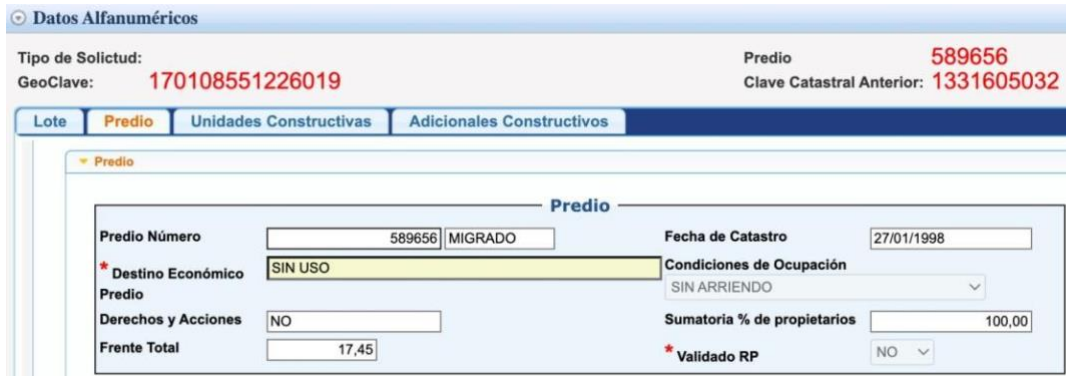
IMAGEN N°4 DATOS DEL PROPIETARIO DEL PREDIO No. 589656

De acuerdo a la información del Sistema Integrado de Registro Catastral de Quito (SIREC-Q) (alfanumérico y gráfico), el predio No. 589656 con clave catastral No. 1331605032 se catastró el 27/01/1998 y se encuentra registrado a nombre del MUNICIPIO DEL DISTRITO METROPOLITANO DE QUITO, sin antecedente histórico de la titularidad de dominio por migración realizada en el año 2007, conforme consta a la fecha en las siguientes imágenes: