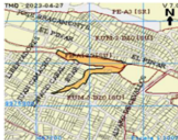
Grafico No. 1

El predio No. 0219279 con clave catastral 40303-37-001, se encuentra ubicado en la parroquia San Juan, Zona Metropolitana Manuela Sáenz.