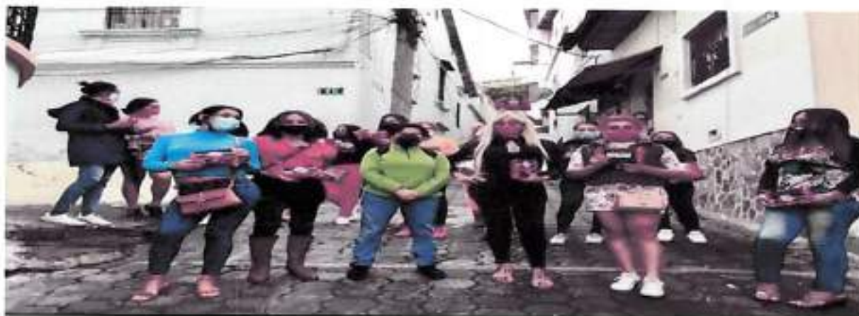
Quito, Mayo 2021 – Entrega de Kits de Salud Sexual y Reproductiva (Centro Histórico)