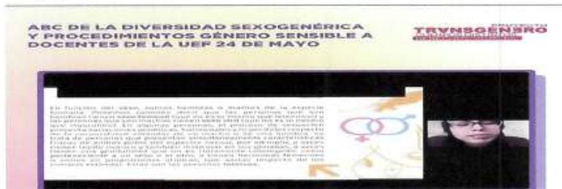
Quito, Marzo 2023 – Taller Virtual ABC de la Diversidad Sexo Genérica, Docentes de la UEF 24 de Mayo