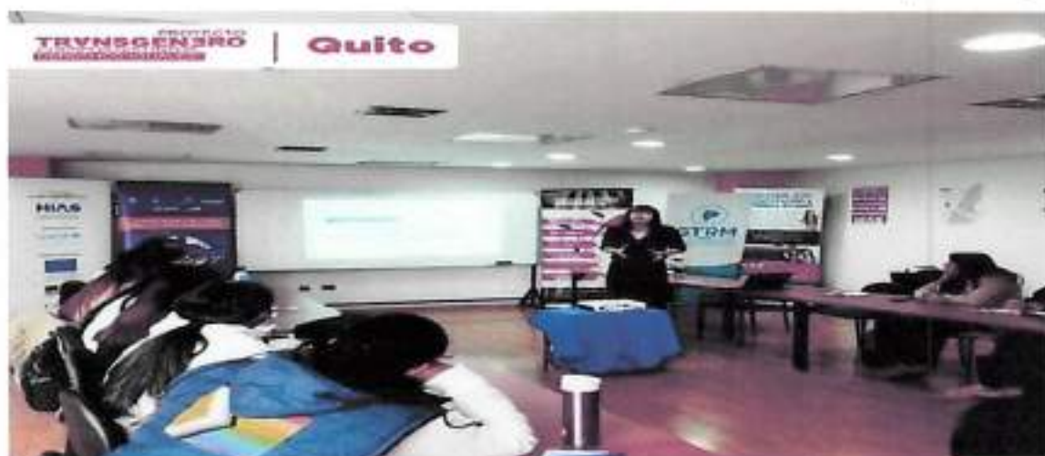
Quito, Mayo 2023 – Taller ABC de la Diversidad Sexo Genérica, Instalaciones de HIAS