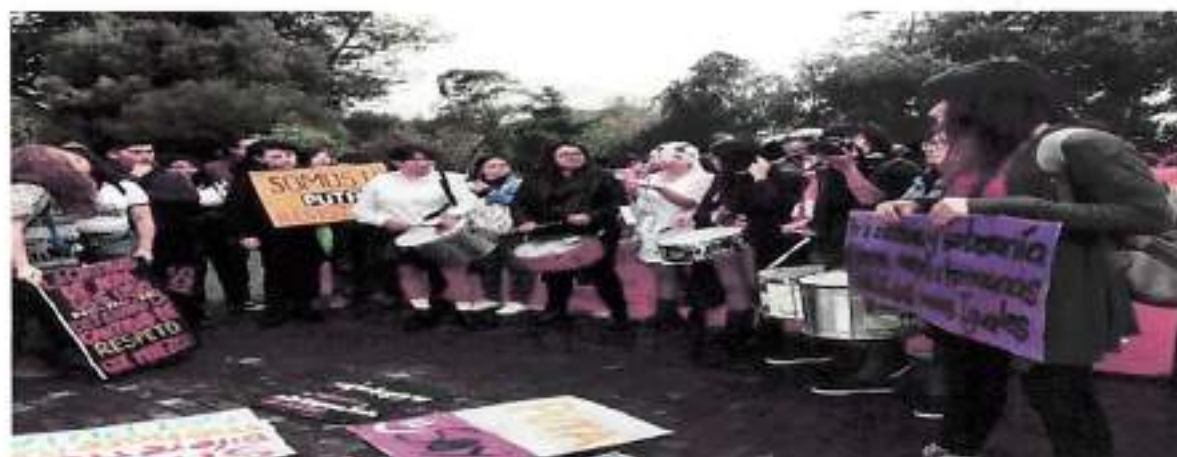
Quito, Agosto 2017 – Marcha de las Putas Ecuador Parque Ejido