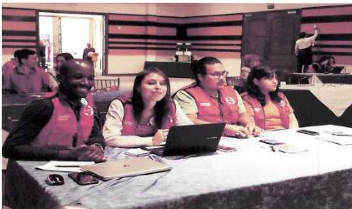
Julio 2023 – Capacitación para la Asistencia Humanitaria por CARE