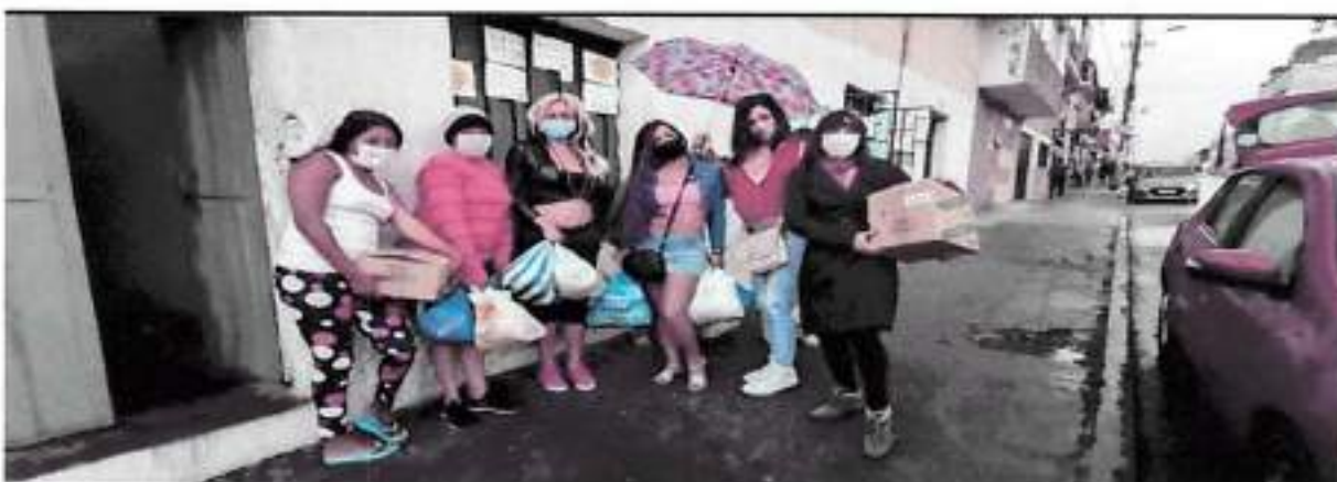
Quito, Agosto 2021 – Entrega de Kits de Alimentos (Barrio Tola)