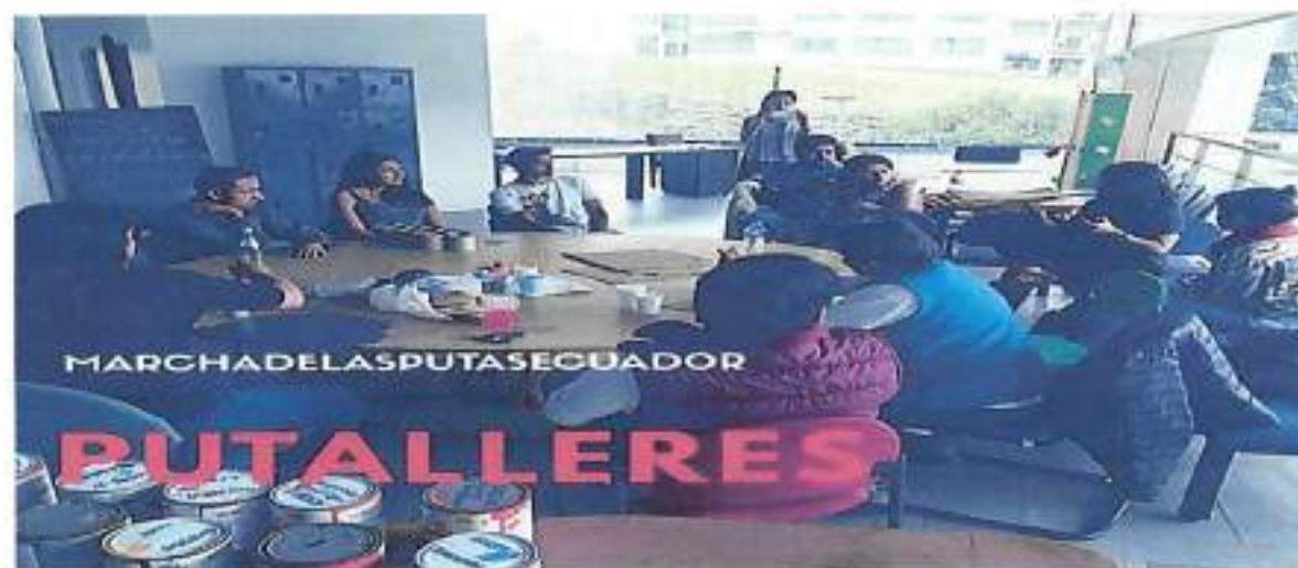
Quito, Julio 2017 – Putalleres Parque Urbano Cumanda