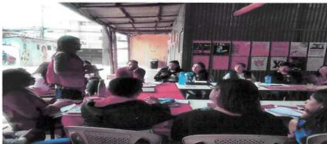
Quito, Marzo 2023 – Taller ABC de la Diversidad Sexo Genérica, Instalaciones del Proyecto Transgénero