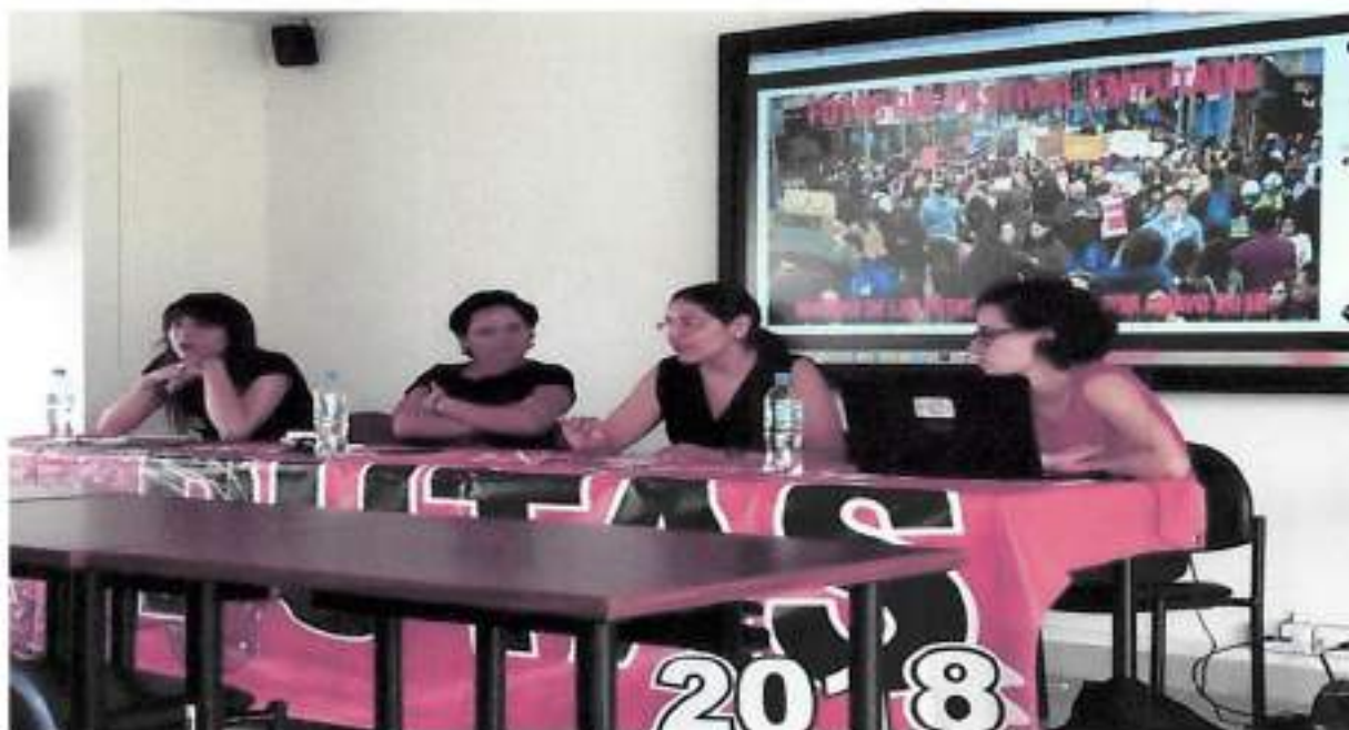
Quito, Agosto 2015 – Jornadas Feministas, Instalaciones de FLACSO