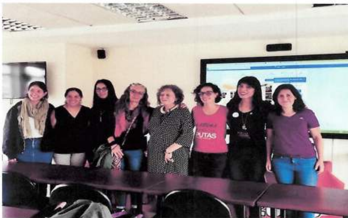
Quito, Agosto 2015 – Jornadas Feministas, Instalaciones de FLACSO