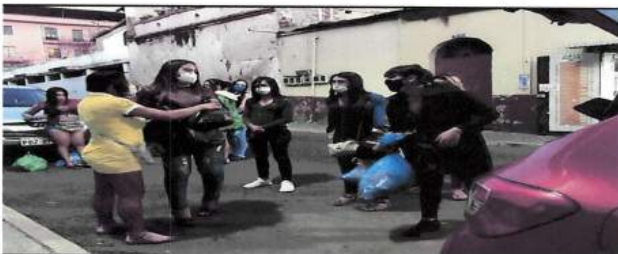
Quito, Junio 2021 – Entrega de Kits de Alimentos (Barrio Tola)