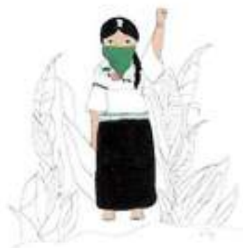
Ilustración: Nary Manat