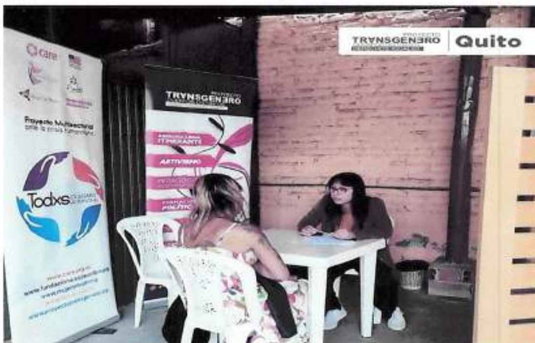
Noviembre 2022 – Registro Atención Social Instalaciones Proyecto Transgénero