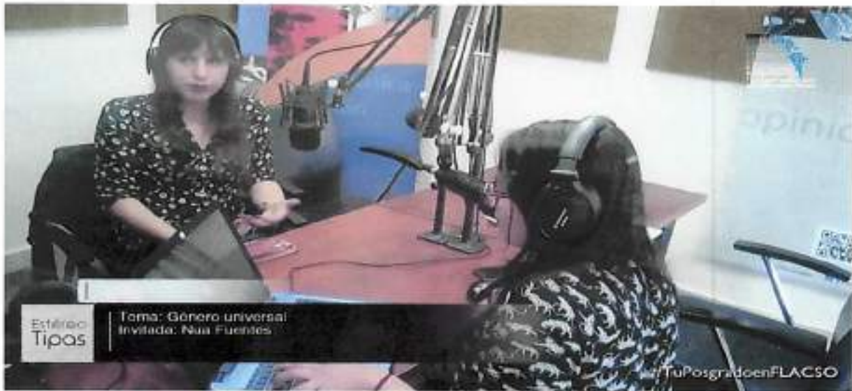
Quito, Noviembre 2015 – Entrevista Radio FLACSO