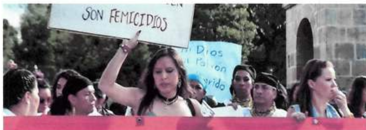
Quito, Marzo 2016 – Marcha de las Putas Ecuador Parque Ejido