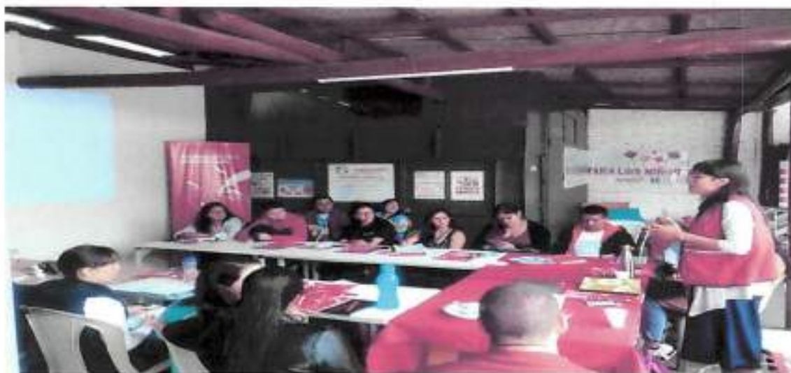
Agosto 2023 – Reunión GTRM Instalaciones Proyecto Transgénero