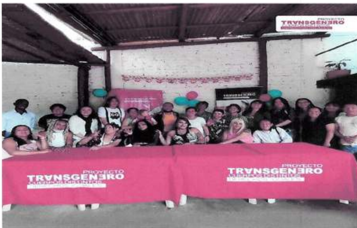
Diciembre 2022 – Cena Navideña con Asociación Trans de Trabajo Sexual Instalaciones Proyecto Transgénero