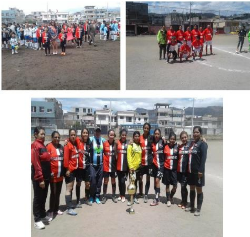
Imágenes de actividades deportivas