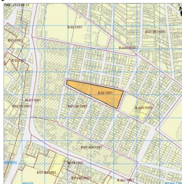
Imagen del predio solicitado