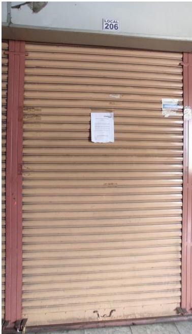
Imagen 3: Local Comercial cerrada