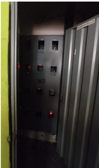
Imagen 3: Tablero luz 145