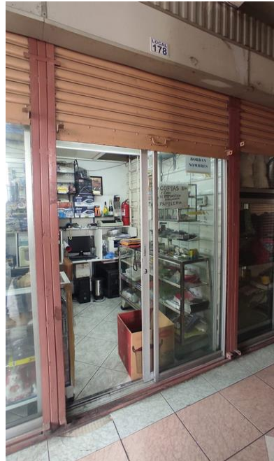
Imagen 4: Local comercial Ocupado