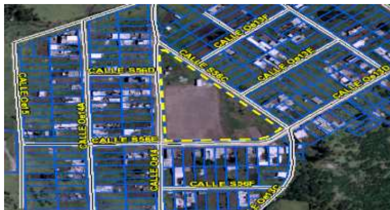
Gráfico No. 1

Zona Metropolitana: QUITUMBE Parroquia: LA ECUATORIANA Barrio/Sector: MANUELA SAENZ Dependencia administrativa: ADMINISTRACIÓN ZONAL QUITUMBE Uso de suelo: (E) Equipamiento