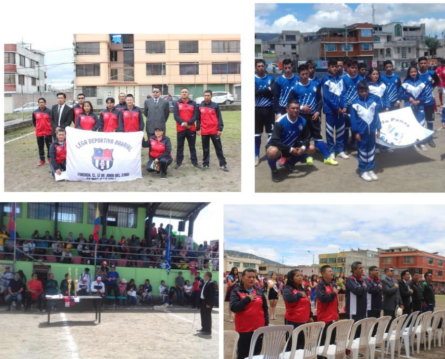
Imágenes de actividades deportivas