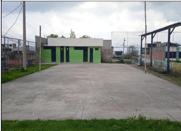
Fotografía 1: Baterías sanitarias, camerinos y cancha de ecuavóley