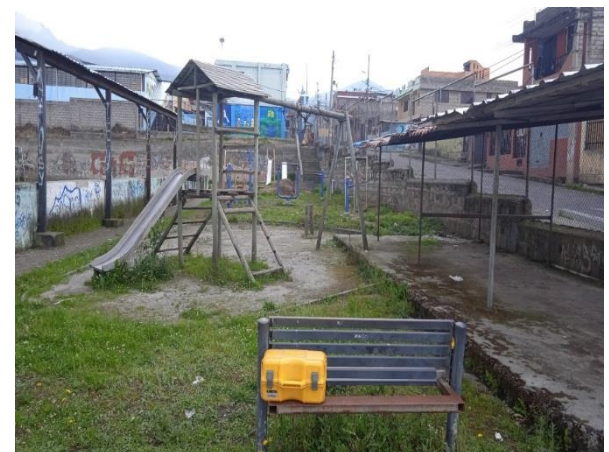
Fotografía 4: Área con Juegos infantiles e inclusivos