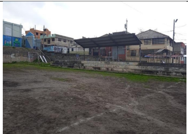
Fotografía 2: Cancha de micro futbol (tierra)