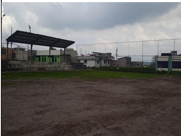
Fotografía 3: Cancha de microfútbol y graderío cubierto lado oriental