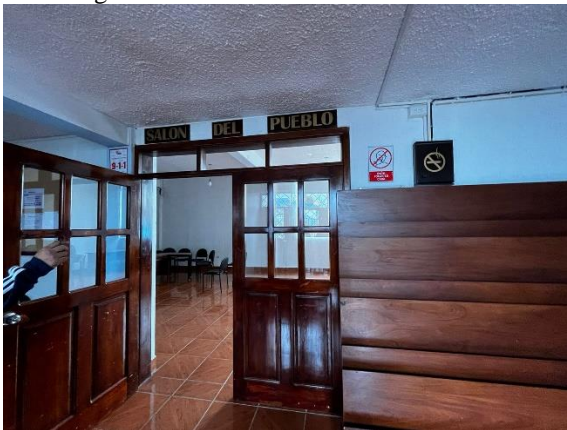
Fotografía 5. Salón del pueblo