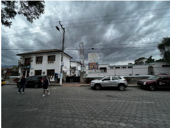
Fotografía 1. Acceso principal