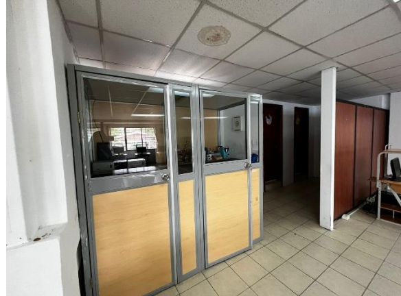
Fotografía 8. Salas de capacitación - planta alta