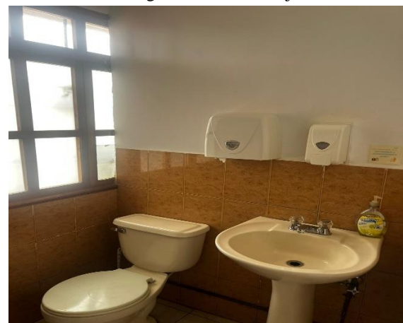
Fotografía 6. Baños