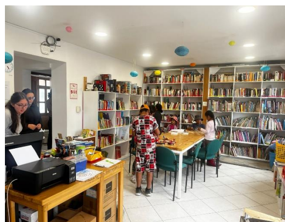
Fotografía 2. Área principal