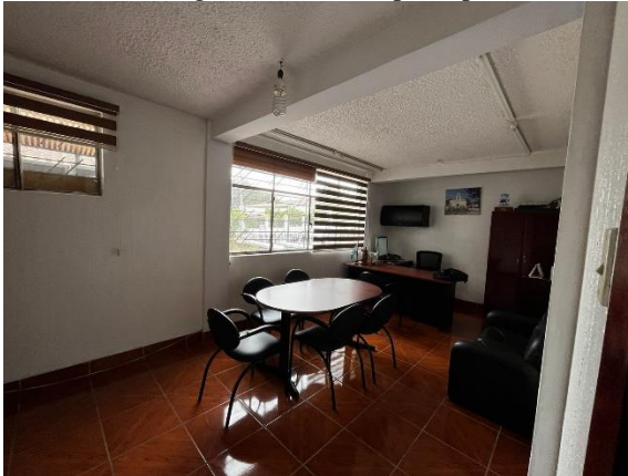
Fotografía 3. Oficina del Presidente del GAD