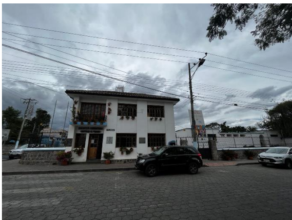
Fotografía 1. Acceso 1