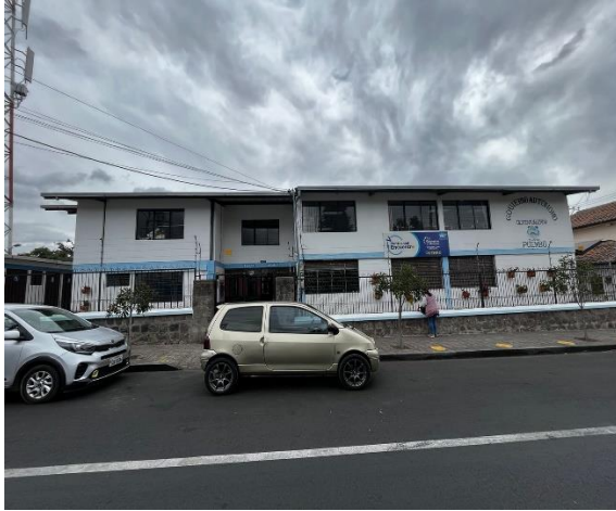
Fotografía 1. Acceso principal