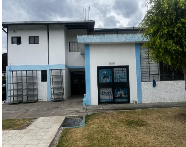
Fotografía 2. Acceso Secundario