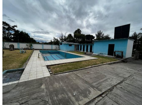
Fotografía 2. Piscina y bloque 2