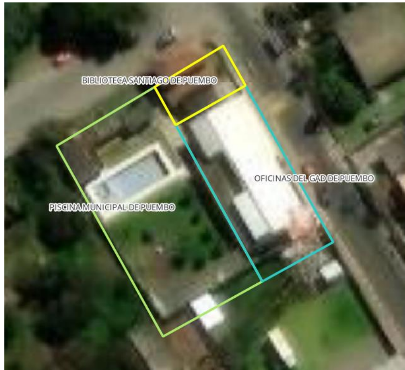
Imagen 2. Esquema referencial de la distribución de entidades

A continuación en la imagen No.2 se presenta un esquema referencial del área que ocupa actualmente cada una de las mismas, el mencionado esquema cumple con el objetivo netamente de presentación y organización del presente informe, cabe aclarar que no existe una división física permanente entre ellas: