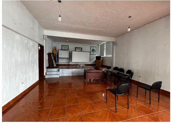
Fotografía 4. Oficinas de vocalía