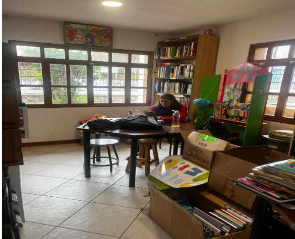
Fotografía 3. Aulas de talleres varios