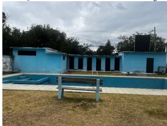
Fotografía 4. Piscinas y bloque 2