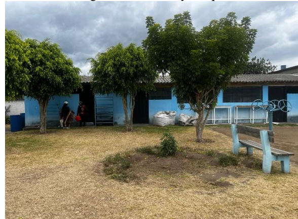
Fotografía 3. Bloque 1