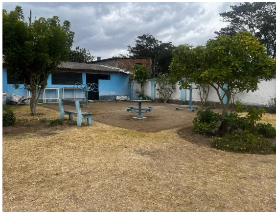
Fotografía 2. Máquinas de ejercicios