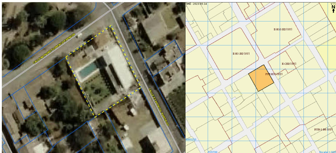
Imagen 1. Predio 375736