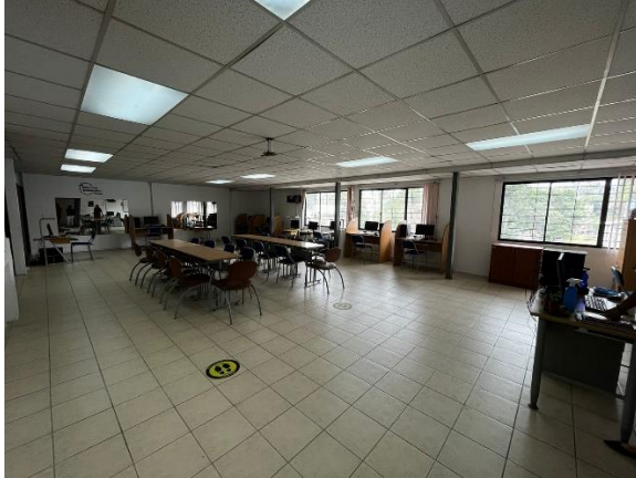
Fotografía 7. Salas de capacitación - planta alta