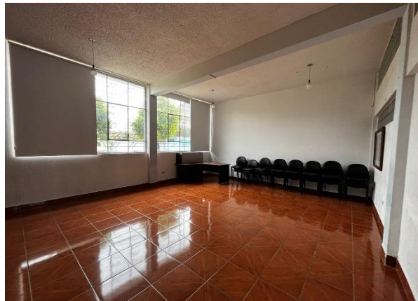
Fotografía 6. Salón del pueblo