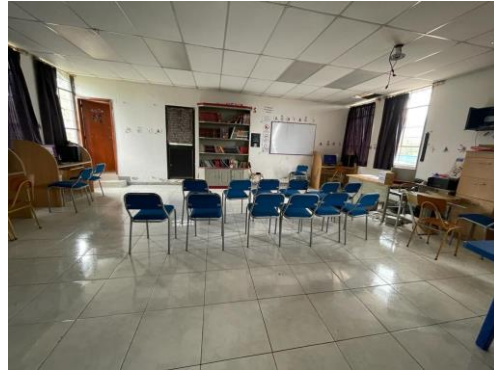
Imagen 7: Cibernario