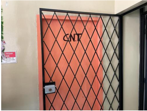
Imagen 6: Espacio ocupado por CNT