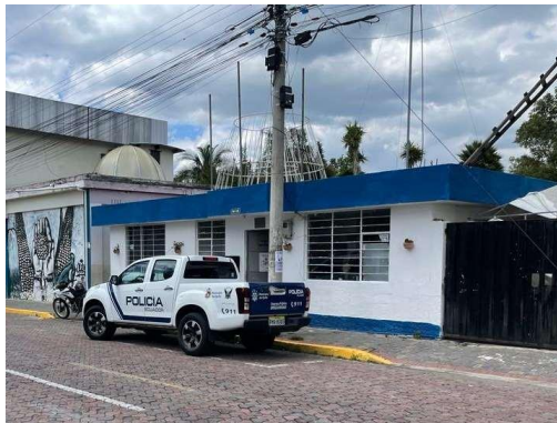
Imagen 8: UPC