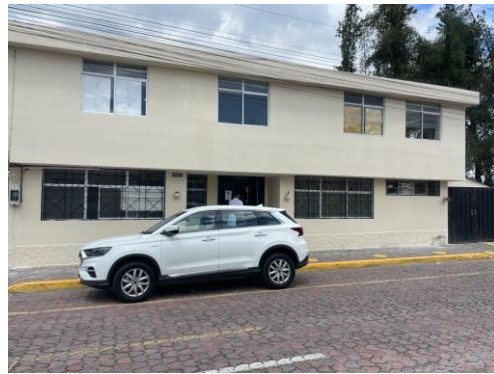
Imagen 9: Centro de Salud