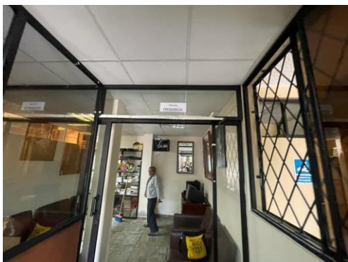
Imagen 4: Oficinas