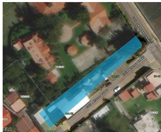
Imagen 1 : Ubicación del predio No. 359395

Predio: 359395 Propietario: Municipio del Distrito Metropolitano de Quito Razón de Propiedad: Compraventa Clave Catastral: 10931-02-004 Sector: Central Parroquia: Tababela Área de Terreno Total: 878,85m 2 Área de Construcción: 878,85m 2 Ubicación: