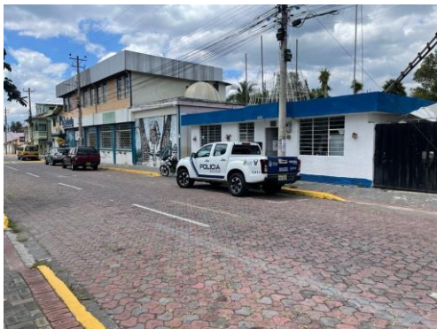
Imagen 2: Vista general predio No. 359395