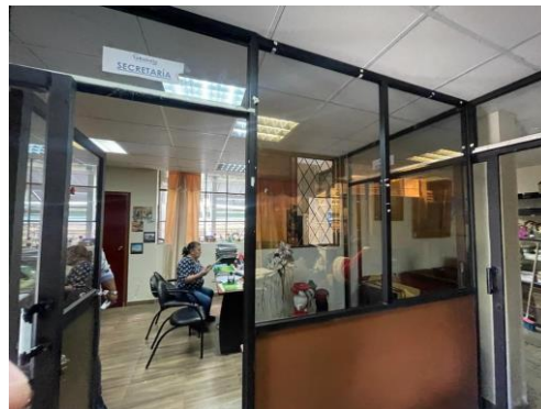
Imagen 3: Oficinas