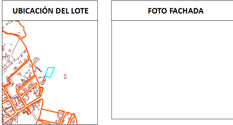
IMAGEN FICHA PREDIAL