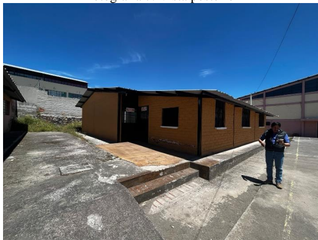
Fotografía 9. Auditorio