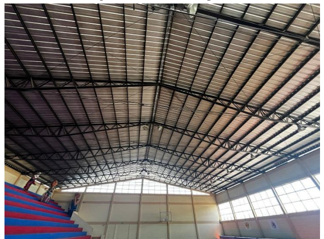
Fotografía 4. Cubierta