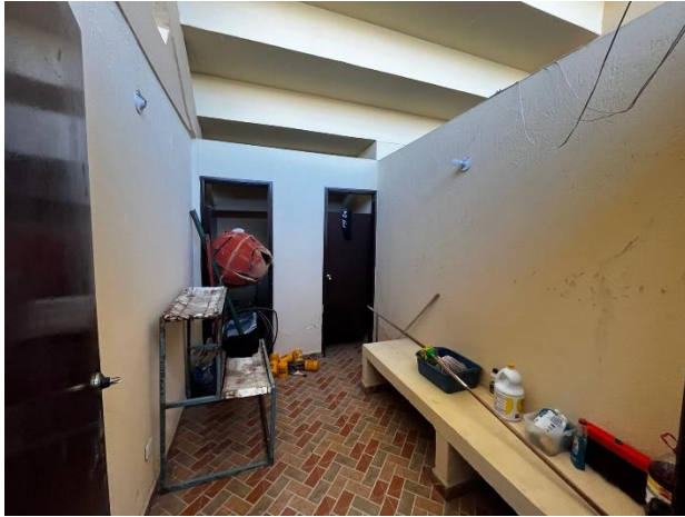
Fotografía 5. Camerinos