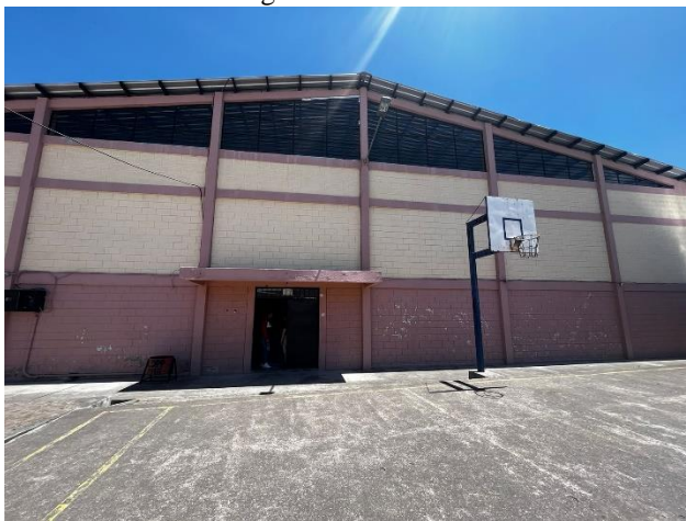
Fotografía 7. Vista posterior