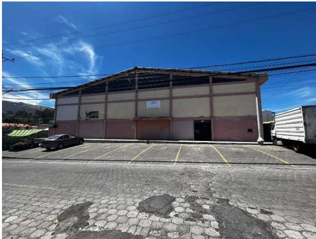
Fotografía 1. Fachada