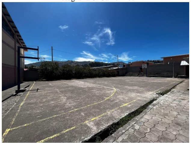
Fotografía 8. Canchas de básquet