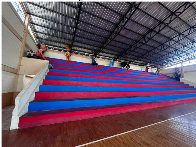
Fotografía 3. Graderíos