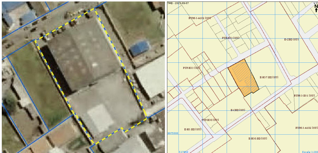
Imagen 1. Predio 3684681