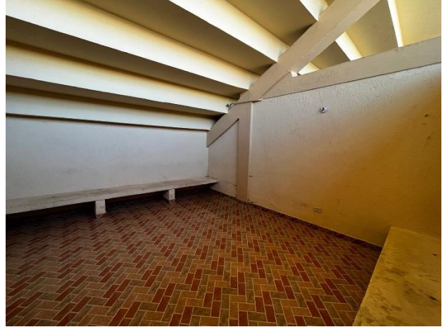
Fotografía 6. Camerinos