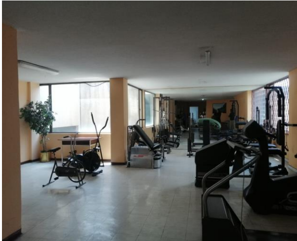
Fotografía 5. Primera planta