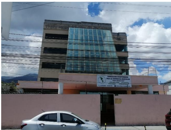
Fotografía 1. Fachada