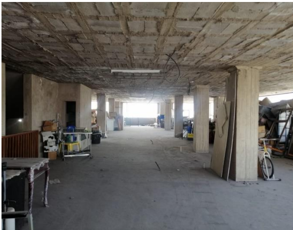
Fotografía 15. Tercera planta – Taller