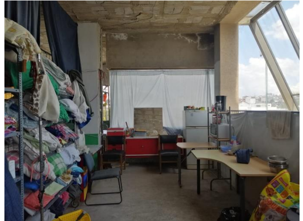
Fotografía 16. Cuarta planta – Albergue de perro en situación de calle