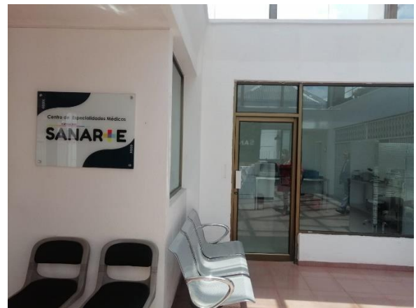
Fotografía 2. Recibidor/hold