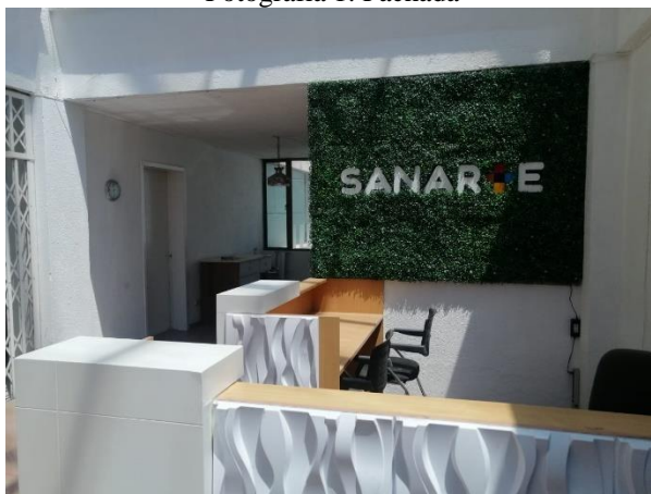
Fotografía 3. Recibidor/hold