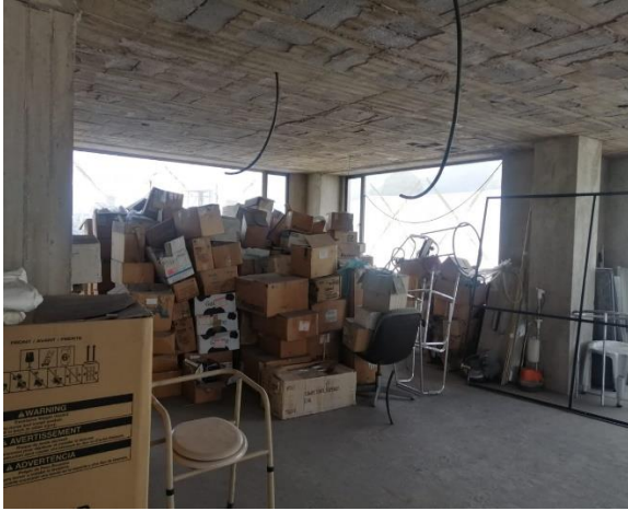
Fotografía 11. Segunda planta