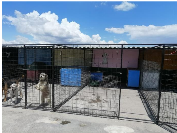
Fotografía 16. Terraza