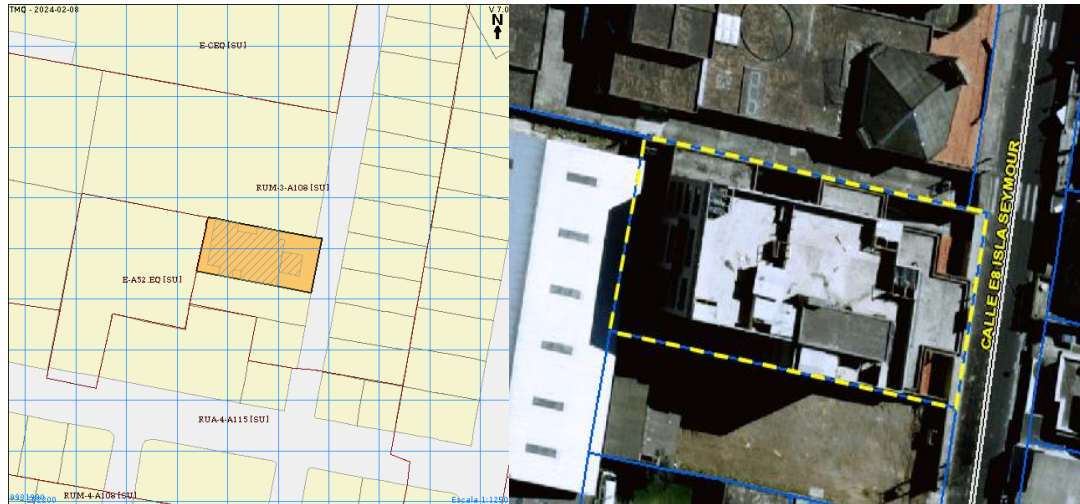
Imagen 1. Predio 406460