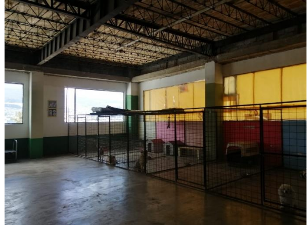
Fotografía 16. Cuarta planta – Albergue de perros en situación de calle