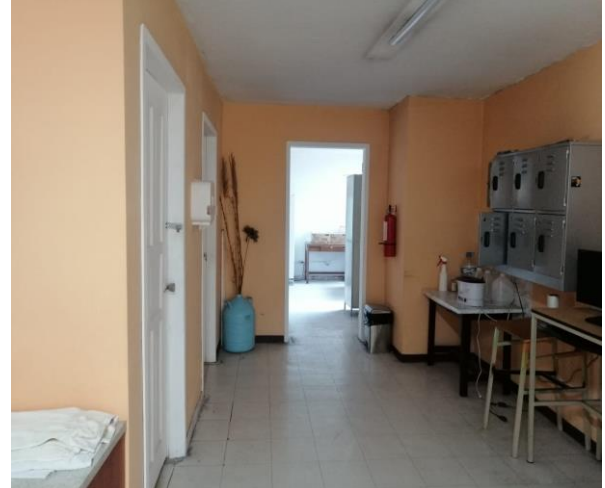
Fotografía 6. Primera planta