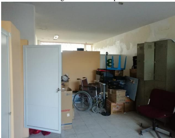
Fotografía 7. Primera planta