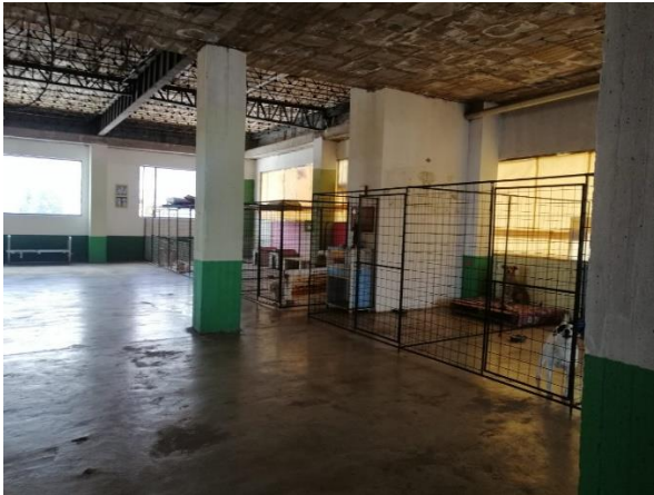
Fotografía 16. Cuarta planta – Albergue de perros en situación de calle