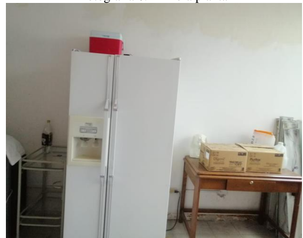
Fotografía 8. Primera planta