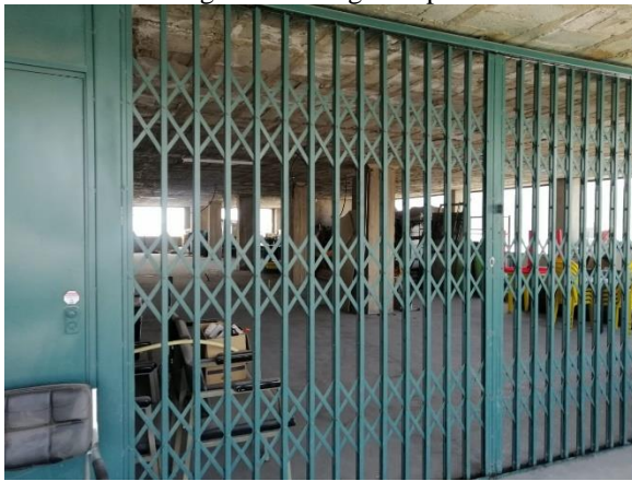
Fotografía 13. Tercera planta