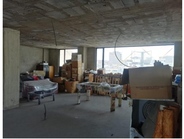
Fotografía 12. Segunda planta