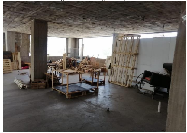
Fotografía 14. Tercera planta – Taller