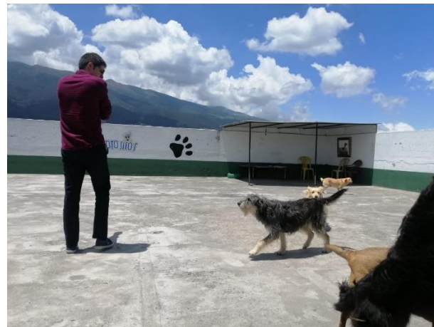
Fotografía 16. Terraza