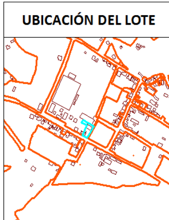
IMAGEN FICHA PREDIAL