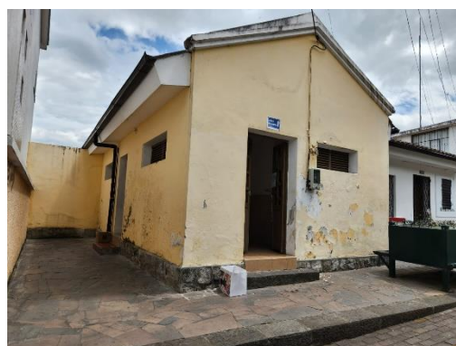
Fotografía 4 baños públicos