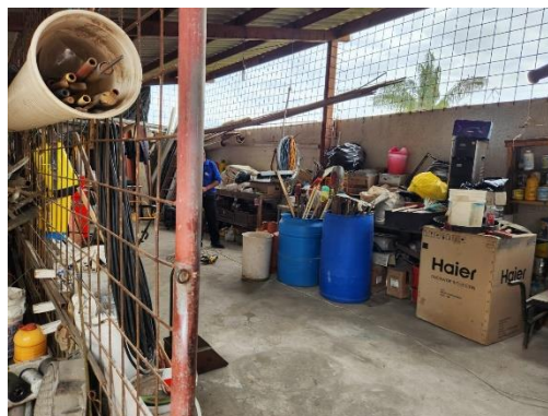
Fotografía 6 bodega del GAD parroquial