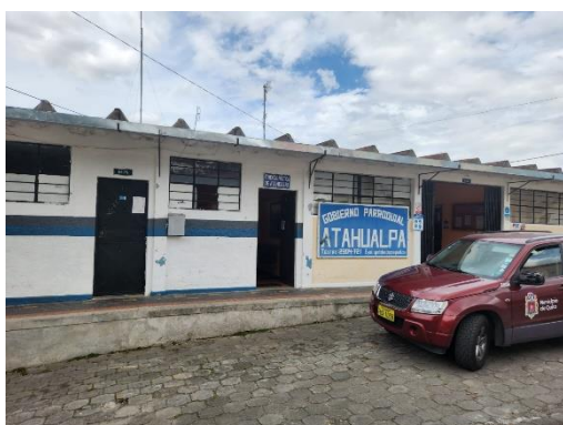
Fotografía 3 vista exterior Tenencia Política