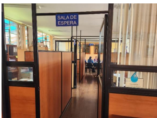
Fotografía 7 vista interior GAD