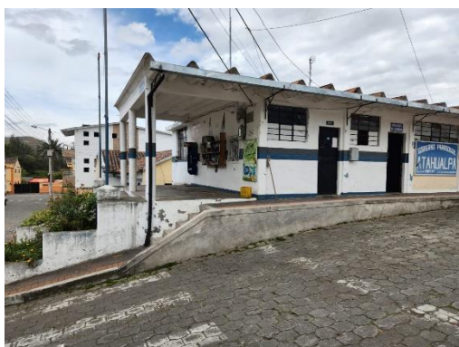
Fotografía 1 vista exterior UPC