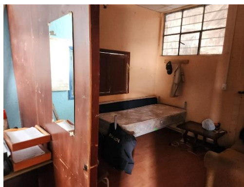
Fotografía 10 vista interior UPC