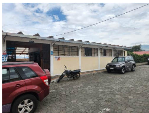
Fotografía 2 vista exterior GAD parroquial