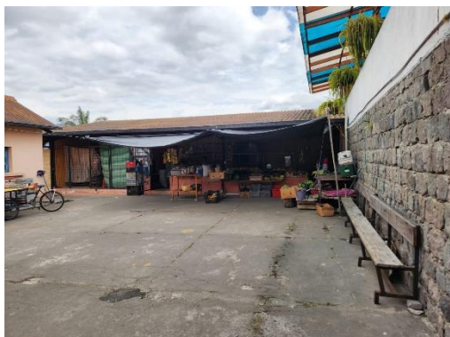
Fotografía 5 mercado