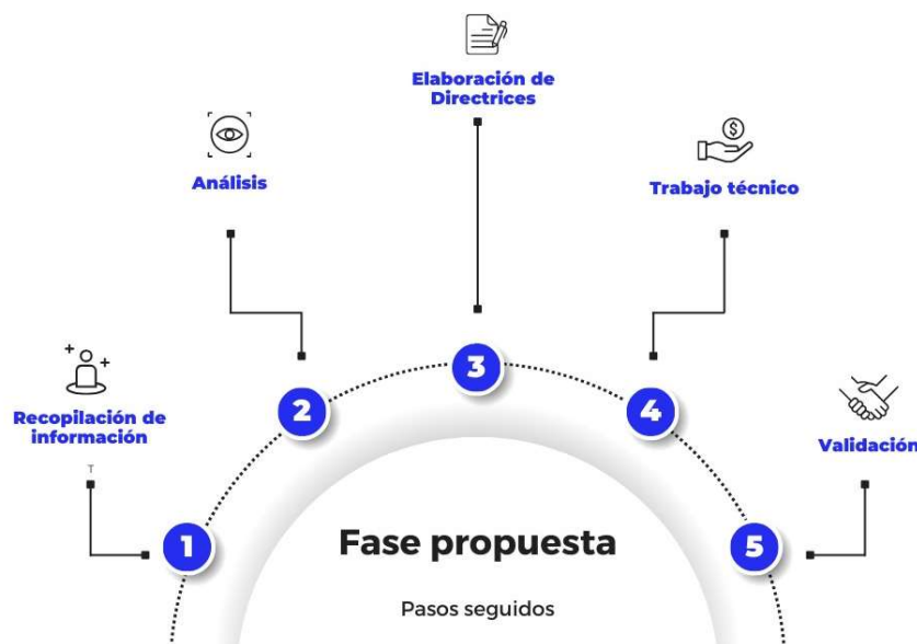
Figura 1. Fases de implementación para formulación/actualización de Metas – Indicadores; Programas – Proyectos; Presupuesto Referencial