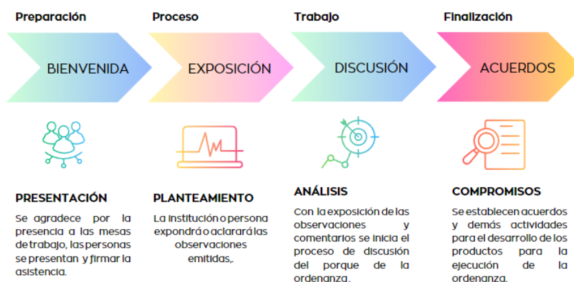
Gráfico 2. Proceso metodológico: Mesas de trabajo