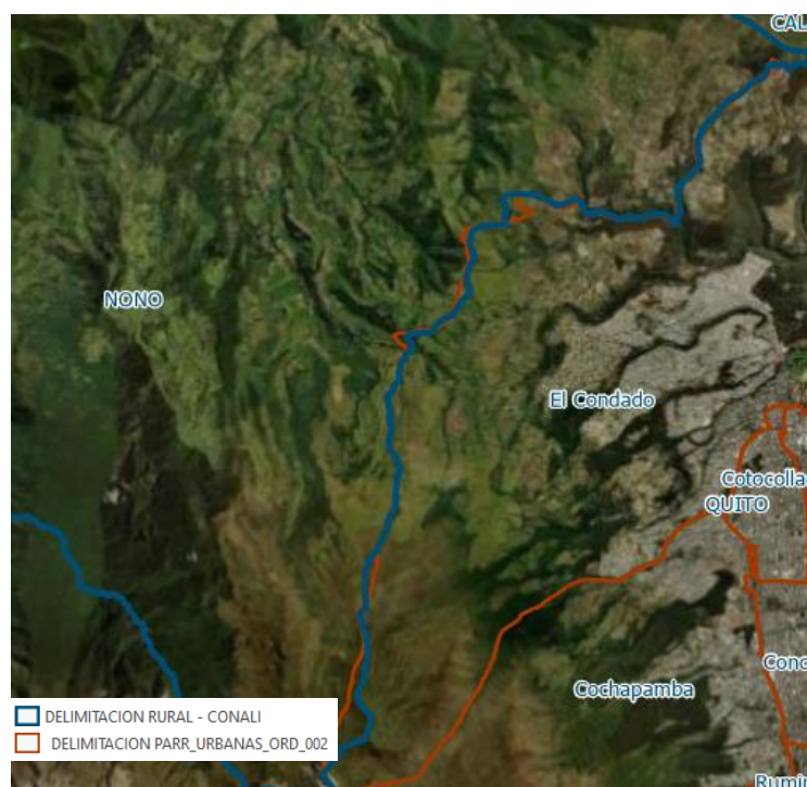
Ilustración 7. Límite Parroquial entre Nono y Condado – actualmente

Los representantes de Nono se encuentran conformes con la delimitación entregada en el Proyecto de Ordenanza anteriormente mencionado, sin embargo, al ser un cambio con límite rural se debe realizar el proceso correspondiente con el Ministerio de Gobierno.