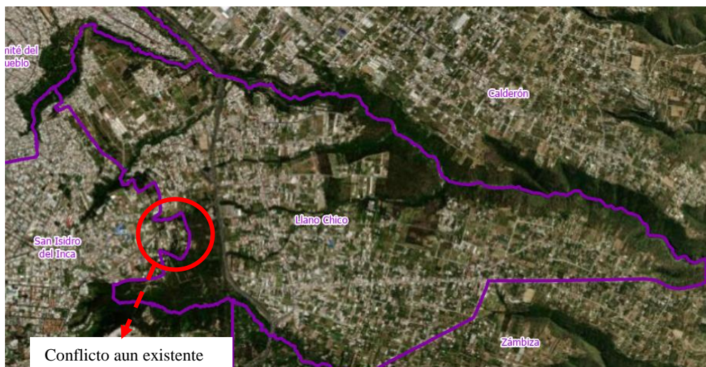
Tabla 4. Límites de la parroquia Llano Chico