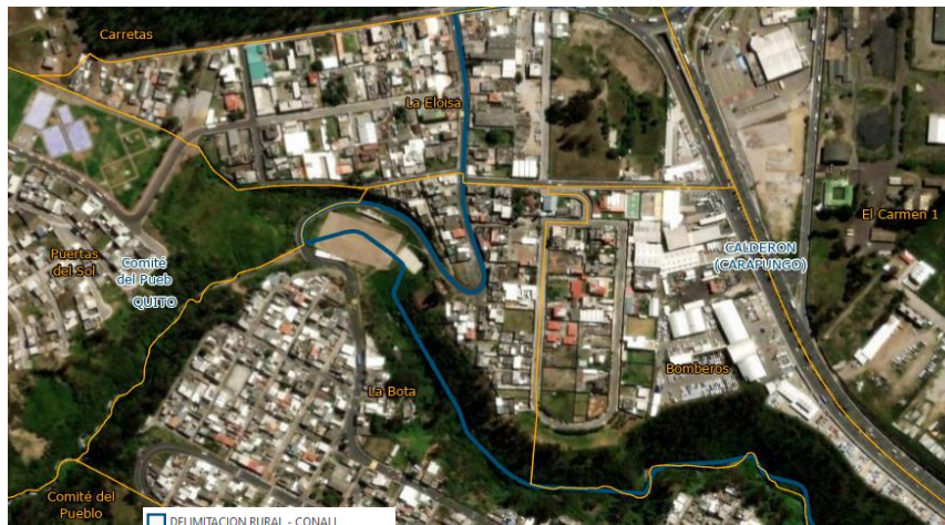
Ilustración 2. Delimitación de la parroquia Comité del Pueblo y parroquia Calderón – proyecto de ordenanza