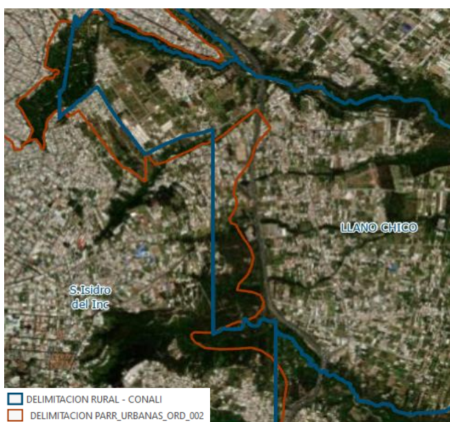
Ilustración 4. Delimitación de la parroquia Llano Chico y parroquia San Isidro – proyecto de ordenanza