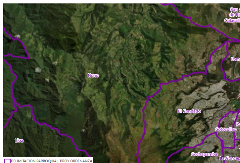
Tabla 8. Límites de la parroquia Nono