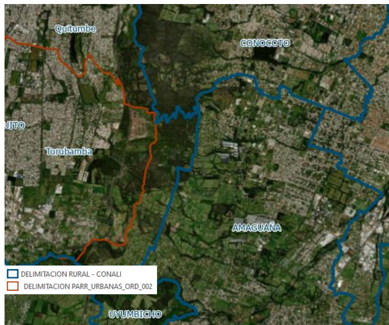
Ilustración 6. Delimitación de la parroquia Amaguaña y parroquia Turubamba – proyecto de ordenanza