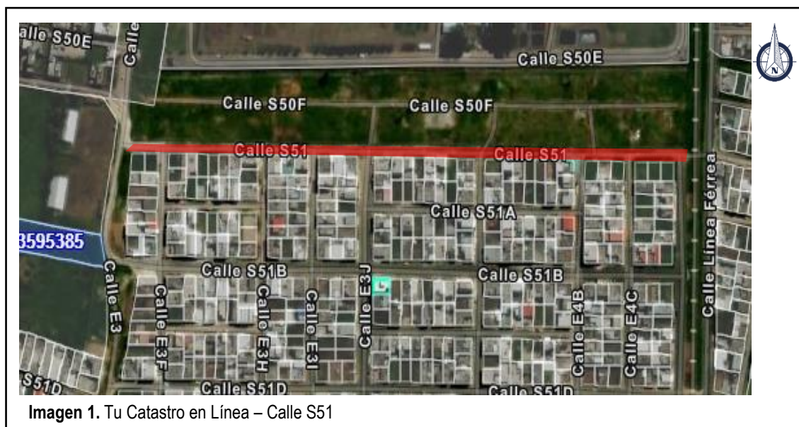
Imagen 1. Tu Catastro en Línea – Calle S51