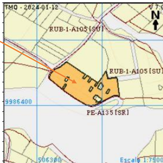
Imagen 2. Ubicación catastral