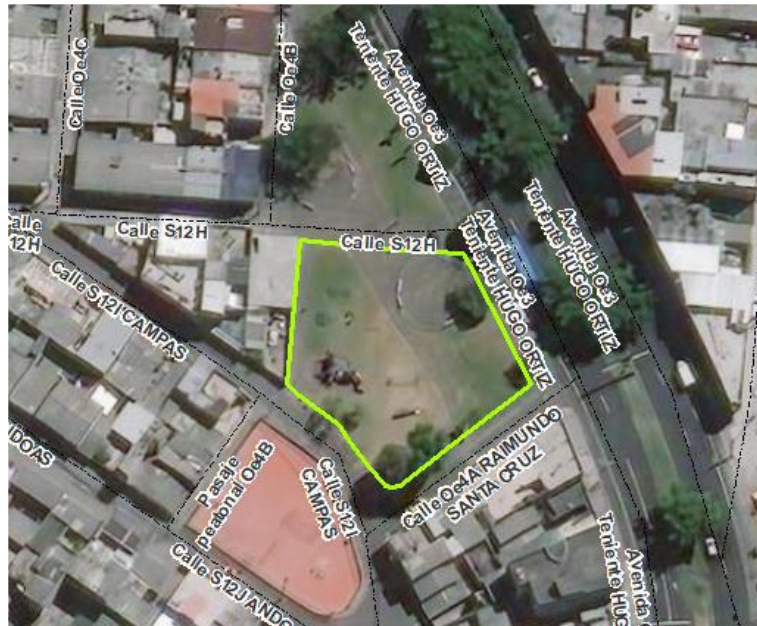
Imagen 3.- Ubicación gráfica de la propuesta de denominación del Parque De las Comunidades.

denominación se propuso para el área verde identificada FÍSICAMENTE en sitio como parque, como se puede apreciar en la imagen a continuación: