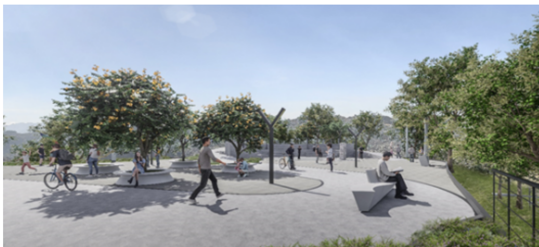
Imagen 8: Imagen referencial de la plaza