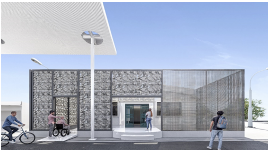
Imagen 6: Imagen referencial de las baterías sanitarias