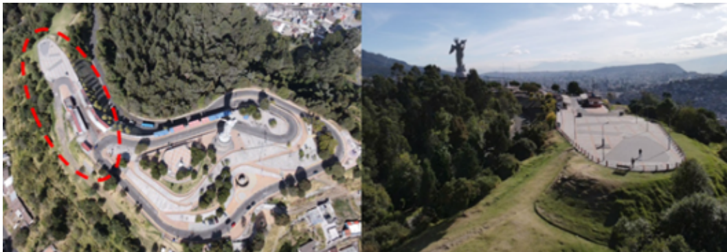
Imagen 1: Ubicación del proyecto.