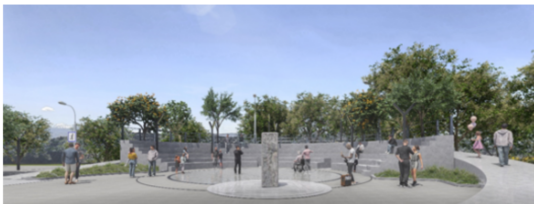
Imagen 7: Imagen referencial del mirador

En el lado sur del Panecillo se construirá un graderío y un mirador, equipado con iluminación instalada mediante postes y la implantación de árboles ubicados estratégicamente para proporcionar sombras. Su construcción contempla preservar al máximo la tradición patrimonial del lugar, evitando alteraciones en el entorno original y respetando las características propias del sitio.