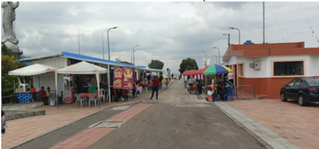
Imagen 2: Vista patio de comidas y batería sanitaria.