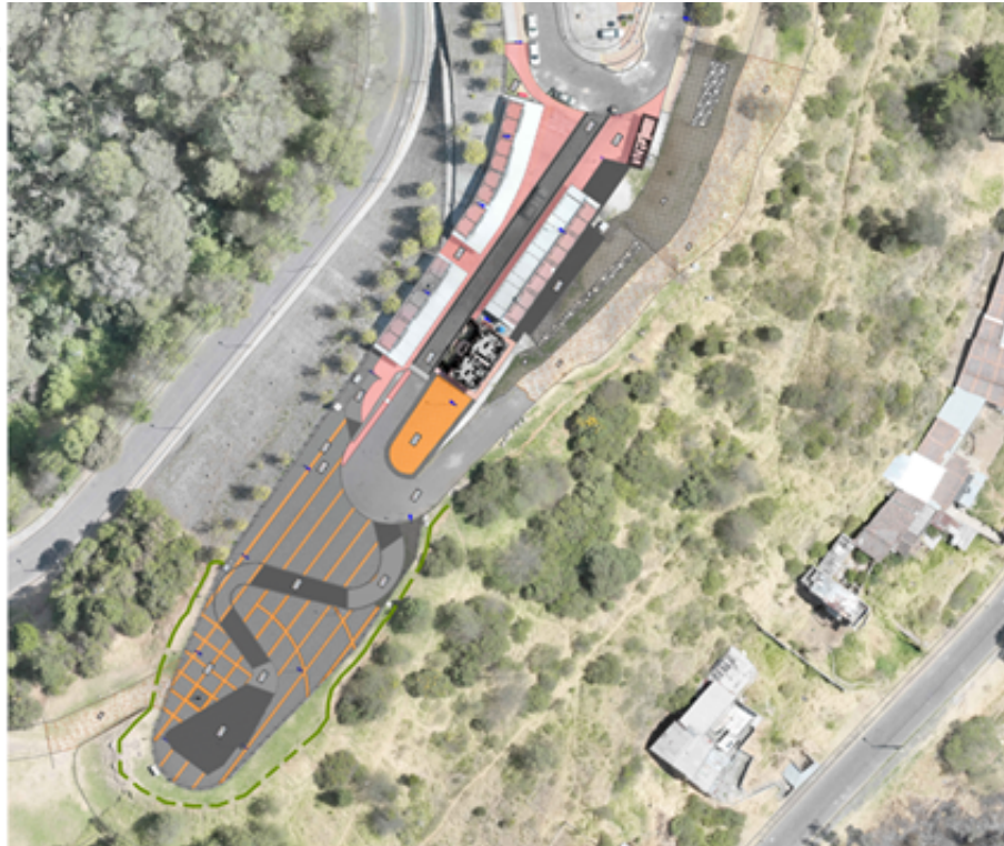
Imagen 3: Implantación estado actual.