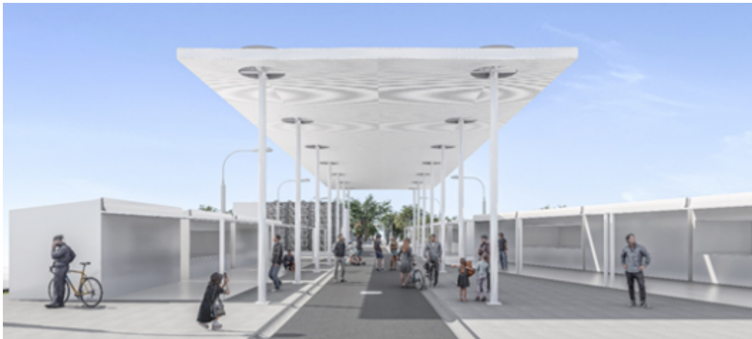
Imagen 5: Imagen referencial de pérgola