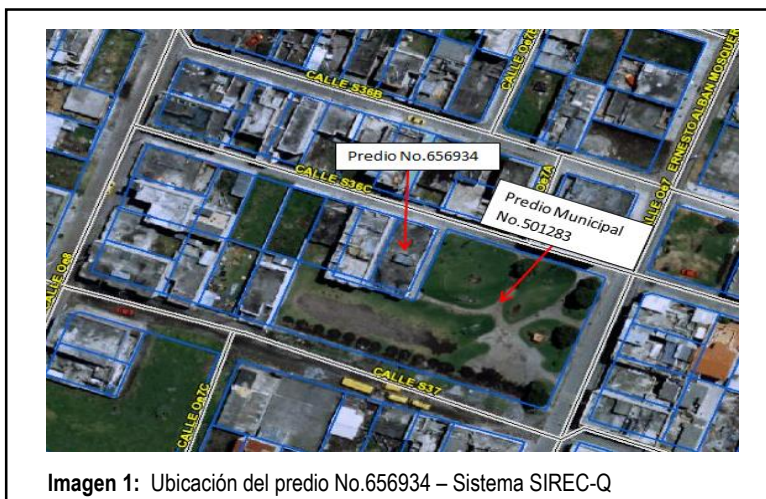
Imagen 1: Ubicación del predio No.656934 – Sistema SIREC-Q