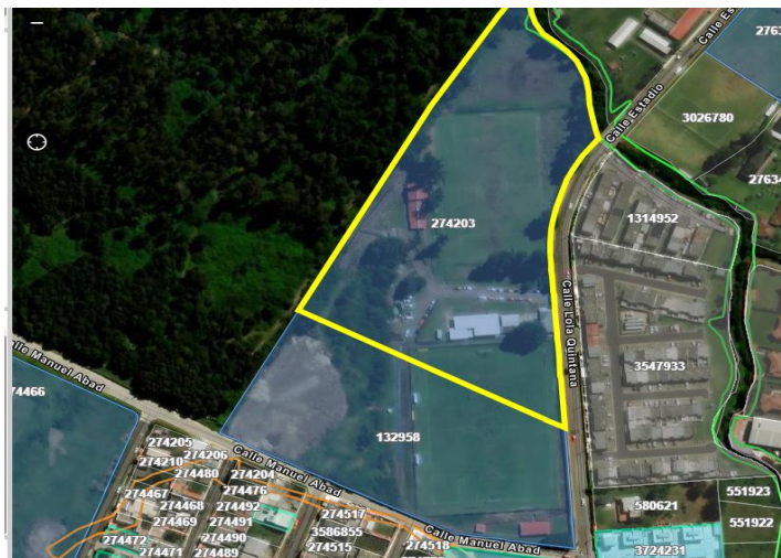
Referencia: Gráfico 1. Mapa Predial oficial 2024 (Catastro-Quito)

Cabe señalar que el requerimiento solicitado comprende los predios: 274203 y 132958, ubicados en el Barrio Armenia, Av. Estadio entre las Calles Benjamín Carrión y Manuel Abad de la Parroquia de Conocoto.