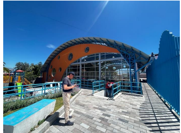
Fotografía 2. Fachada