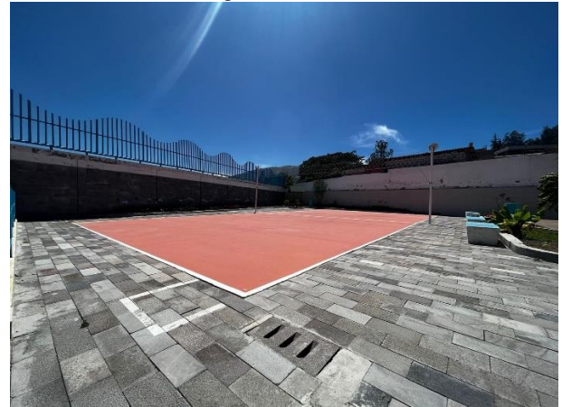
Fotografía 4. Cancha de Vóley