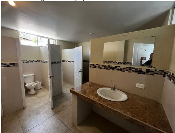
Fotografía 9. Baños