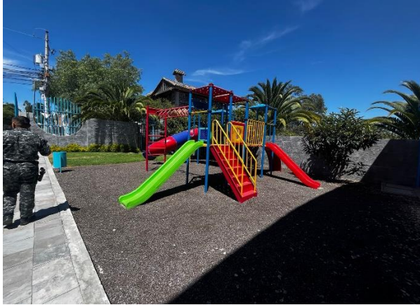
Fotografía 5. Juegos infantiles