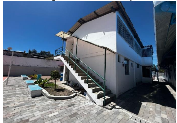
Fotografía 8. Camerinos, duchas y baños