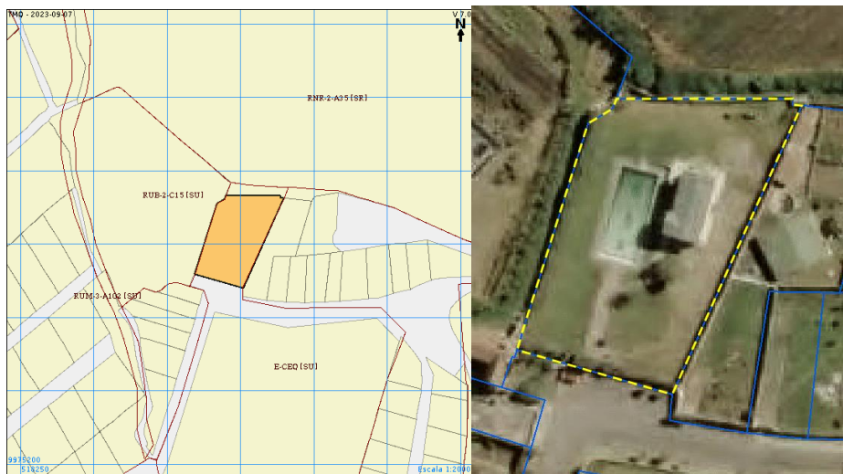
Imagen 1. Predio 370289

*Los datos técnicos consultados a la fecha 08/07/2024.