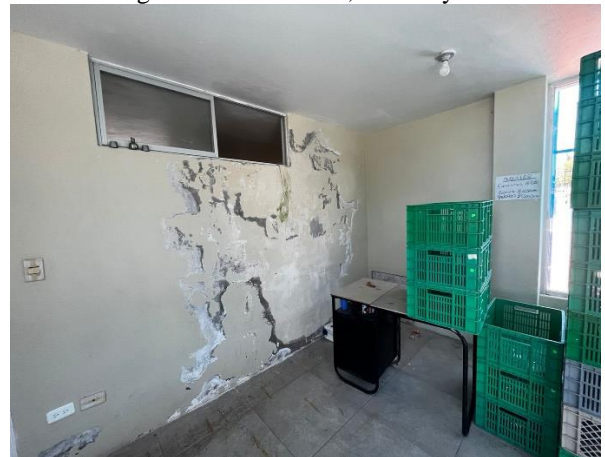
Fotografía 10. Camerinos