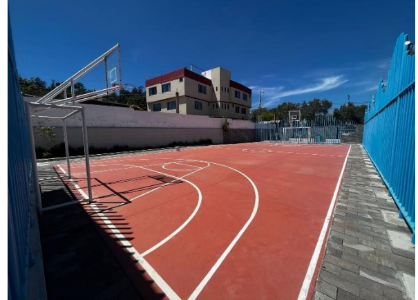
Fotografía 6. Canchas de básquet