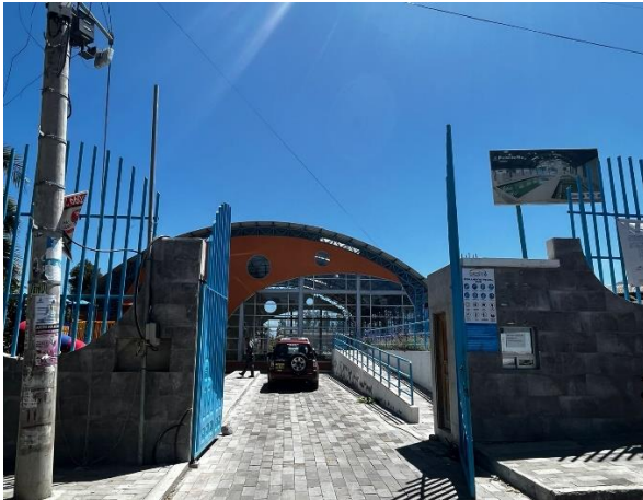
Fotografía 1. Acceso Principal