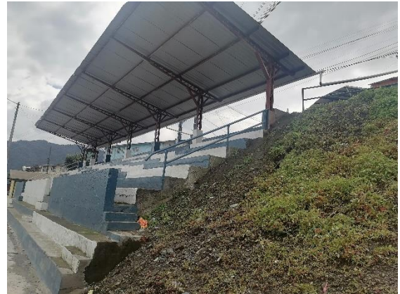
Vista Lateral Derecha

El área de la tribuna es de 189.60 m 2 (según plano del levantamiento). El graderío es de hormigón, construido sobre el talud ente las calles que limitan la tribuna al norte y al sur. Al interior de la tribuna existen 6 filas del graderío con huellas de 70cm y contrahuellas de 40 cm en promedio y un área de circulación en la parte superior de 1.60m; en la parte exterior, delante del murete existen dos filas más con contrahuella menores de 44 cm en promedio (ver vista lateral derecha). Los graderíos interiores están limitados por pasamanos de tubo. Desde la parte frontal existen dos graderíos de acceso; en el costado izquierdo, hacia la batería sanitaria, también existe un graderío que permite la circulación peatonal entre las calles que limitan la tribuna al norte y al sur.