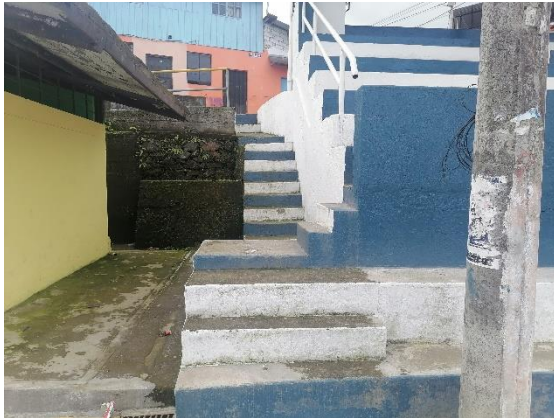
Vista Lateral Izquierda