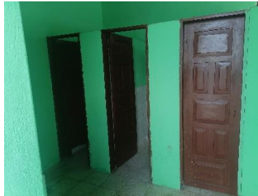
Interior área de mujeres