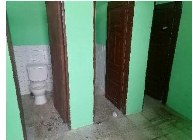
Interior área de hombres

El área cubierta es de 33.03 m 2 (según plano del levantamiento), construida con estructura metálica, sobre la cual se tiene una loseta de hormigón a dos aguas. Contrapiso de H.S. con revestimiento cerámico, mampostería de bloque enlucida y pintada, con revestimiento cerámico de 1m de alto en las áreas interiores de los inodoros, urinario colectivo y lavamanos colectivo.