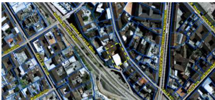
Grafico No. 1

Zona Metropolitana: MANUELA SÁENZ Parroquia: CENTRO HISTÓRICO Barrio/Sector: SAN SEBASTIÁN Dependencia administrativa: ADMINISTRACIÓN ZONAL MANUELA SÁENZ