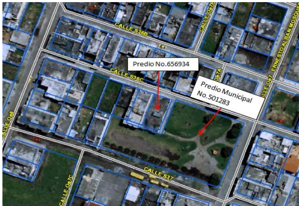
Gráfico 1: Ubicación del predio No.656934 – Sistema SIREC-Q