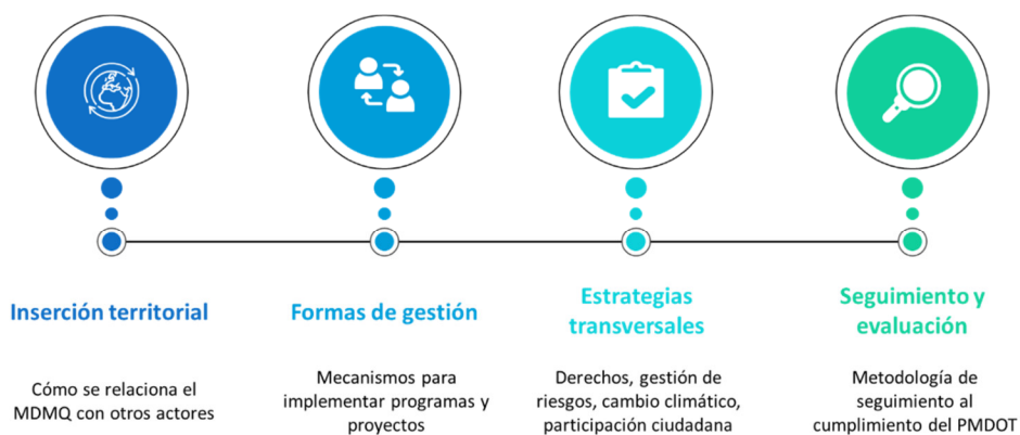
Figura 4. Contenido de componente de Modelo de Gestión

El modelo de gestión es el componente del PDOT que contiene un conjunto de estrategias y procesos de gestión que ejecuta el GAD para la administración de su territorio, a fin de solventar los problemas y desafíos identificados en el componente de diagnóstico y alcanzar los objetivos, estrategias, políticas, planes, programas, proyectos planteados en el componente de propuesta.