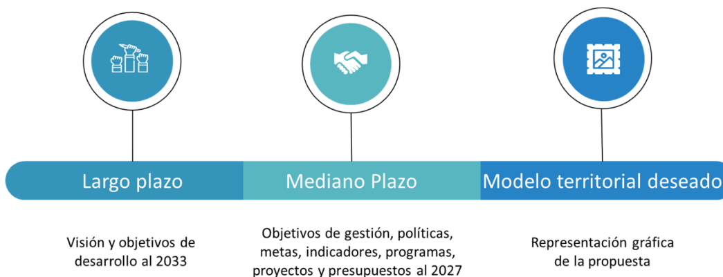
Figura 3. Contenido de componente de Propuesta

La propuesta es el conjunto de decisiones estratégicas que deben implementarse en el territorio para alcanzar la visión y objetivos de desarrollo. Estas deben ser decisiones concertadas y articuladas con los actores territoriales para asegurar la legitimidad y viabilidad de los objetivos, políticas, planes, programas y proyectos que se propongan con una proyección a 10 años, para el Distrito Metropolitano de Quito.