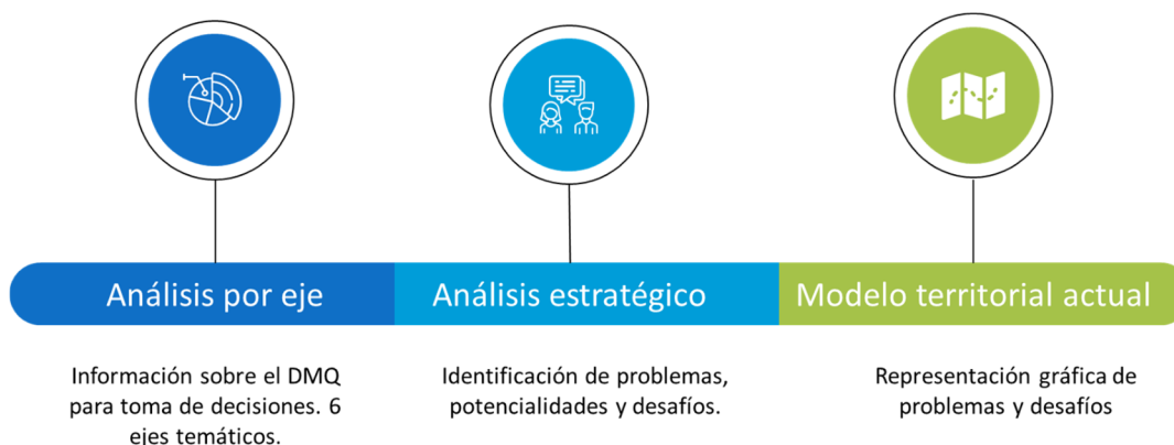
Figura 2. Contenidos de componente de Diagnóstico