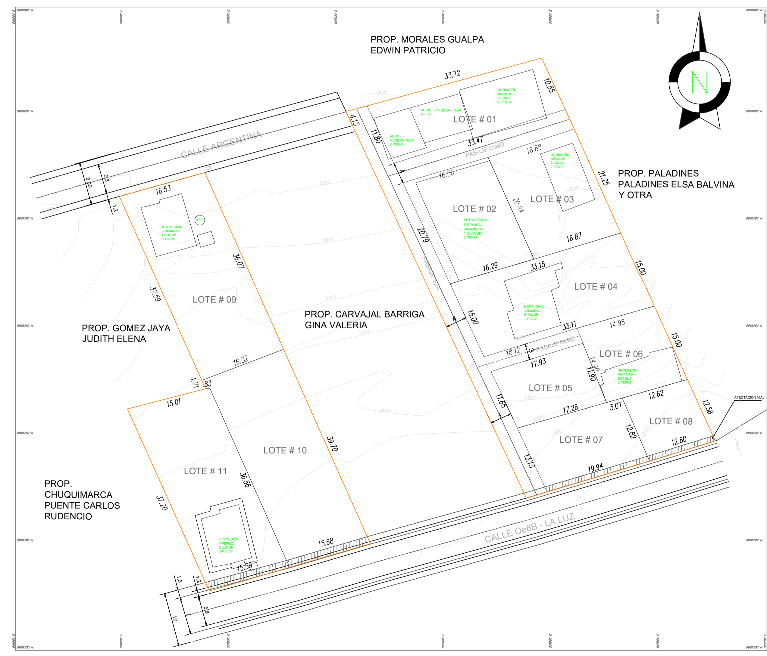
IMPLANTACIÓN GENERAL ESCALA 1:200