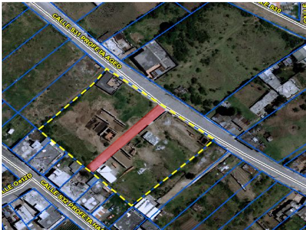
Imagen 1. Lote de terreno signado con predio Nro. 174700, ubicado en el Sistema Integrado de Registro Catastral de Quito (SIERC-Q).

Predio Nro. 174700 Parroquia Chillogallo. Pasaje Oe12D