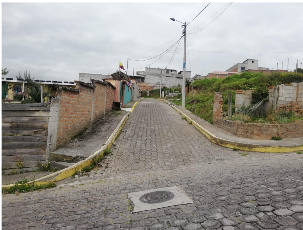
Fotografía 1. Pasaje Oe12D- Estado actual consolidada con bordillos, aceras y una capa de rodadura adoquinada.