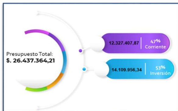
Tabla 1: Presupuesto UPMSJ

La Unidad Patronato Municipal San José con corte al 31 de julio de 2023, cuenta con un presupuesto codificado de USD. 26.437.364,21 , distribuido de la siguiente manera: