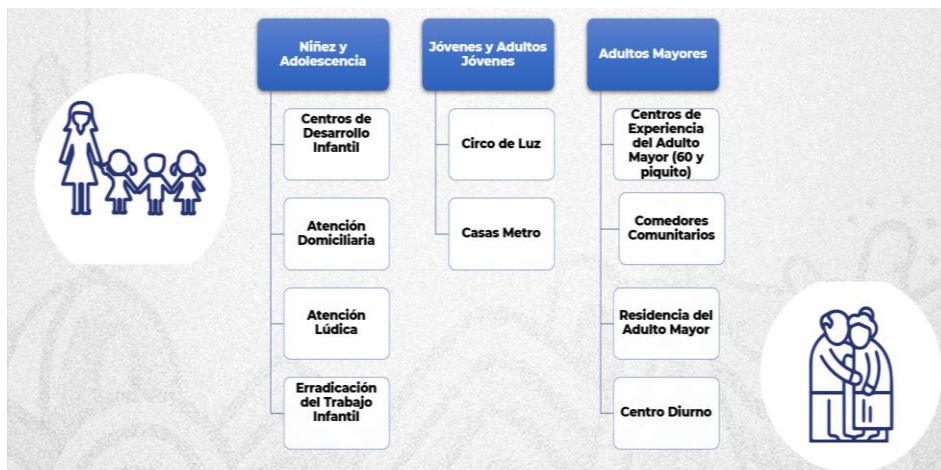
Ilustración 2: Servicios de atención en el ciclo de vida