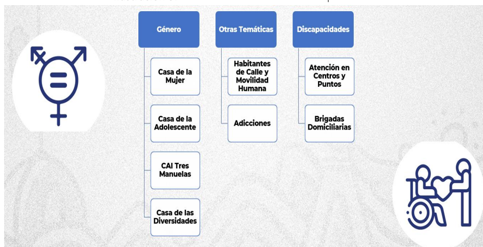
Ilustración 3: Otros servicios de atención especializada