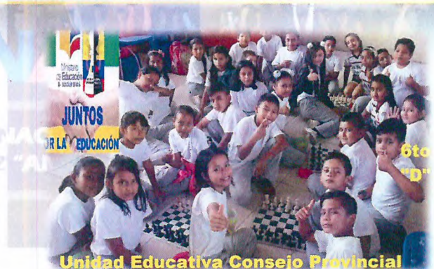
Unidad Educativa Consejo Provincial