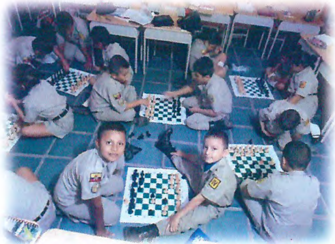
Colegio Giovanni Calles 2014 – 2016.