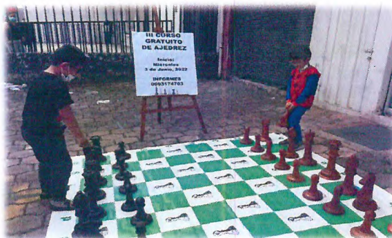
Aprendizaje al aire libre con tablero gigante