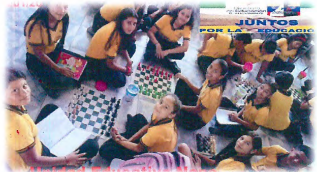
U.E. Napo 2018. TENA