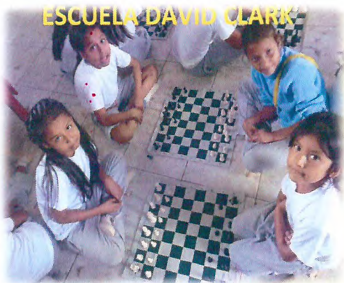
Escuela David Clark 2015. QUITO