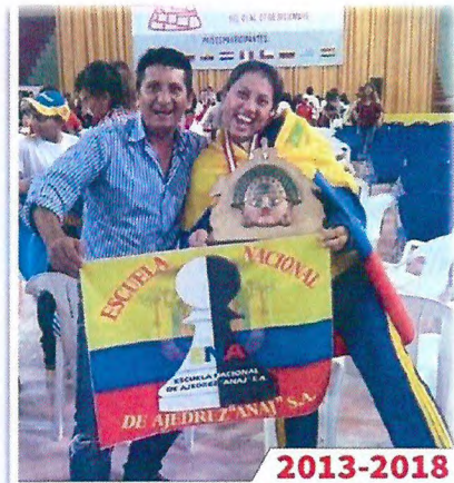
2013-2018 -17 MEDALLAS INTERNACIONALES -CM,WMI,WMF,WCM