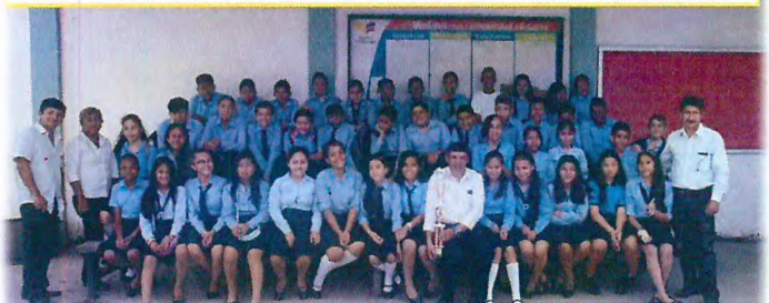
CAMPEONES INTERCOLEGIALES DE AJEDREZ 2019 CAMPEONES INTERCOLEGIALES DE AJEDREZ 2018