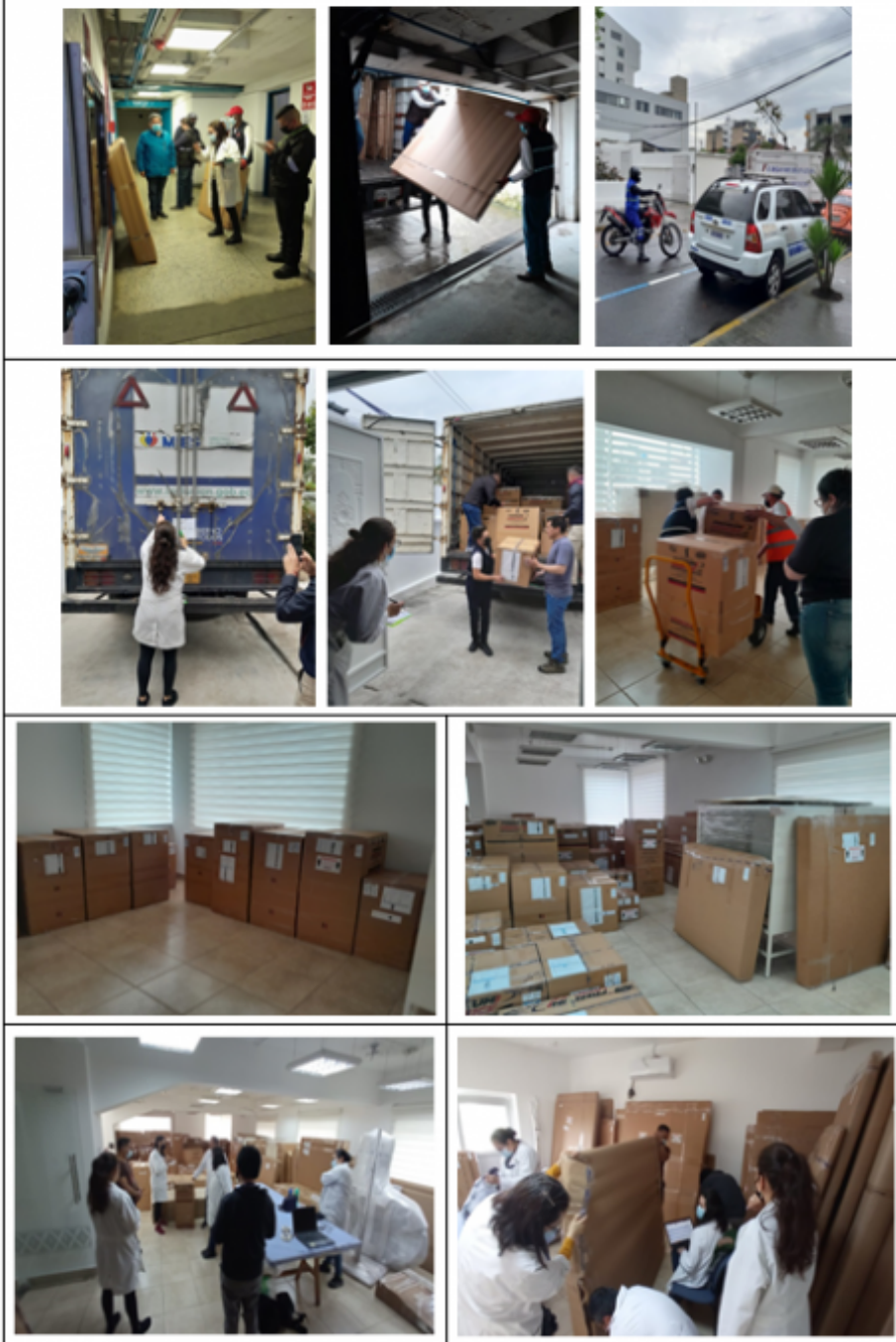
Traslado y desembalaje de bienes muebles patrimoniales desde el edificio Aranjuez hasta edificio Ex – CIMPC (nueva reserva MCYP)