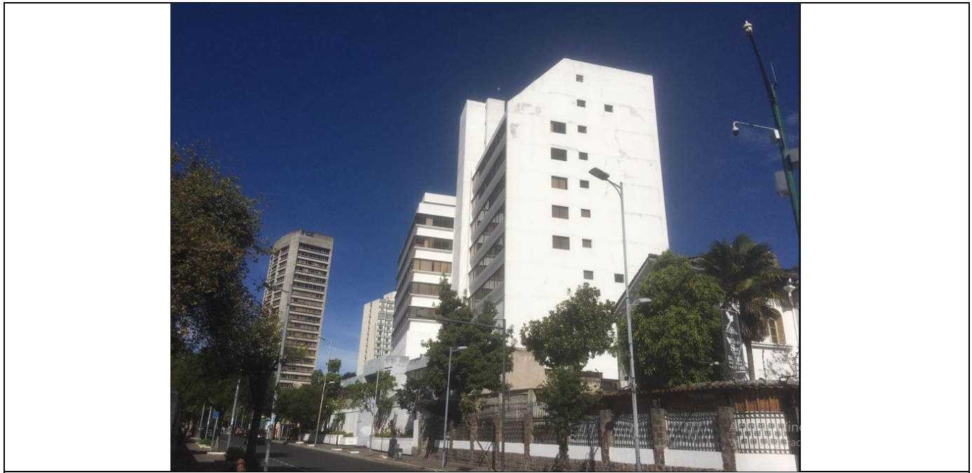
Imagen N° 2: Vista sureste de la edificación del predio nro. 94506.