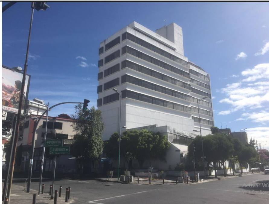
Imagen N° 1: Vista noroeste de la edificación del predio nro. 94506.