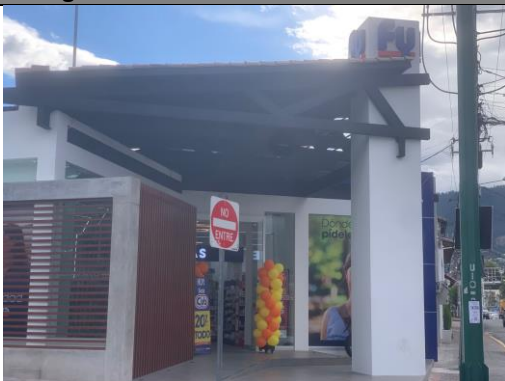
Imagen 1: Elemento publicitario