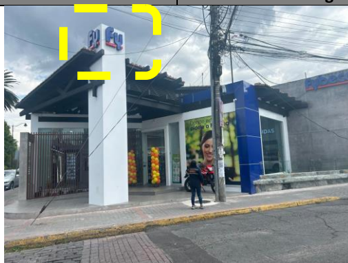
Imagen 3: elemento publicitario