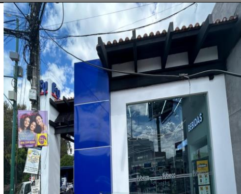
Imagen 2: Elemento publicitario