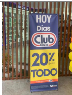
Imagen 2: Elemento publicitario