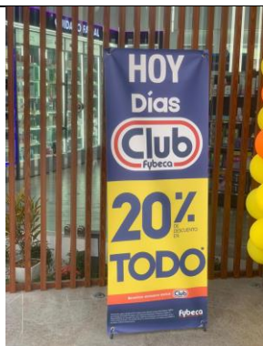
Imagen 1: Elemento publicitario