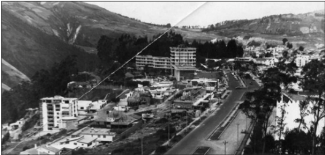
Fotografía 1.- Construcción del hotel (al fondo), en 1959.