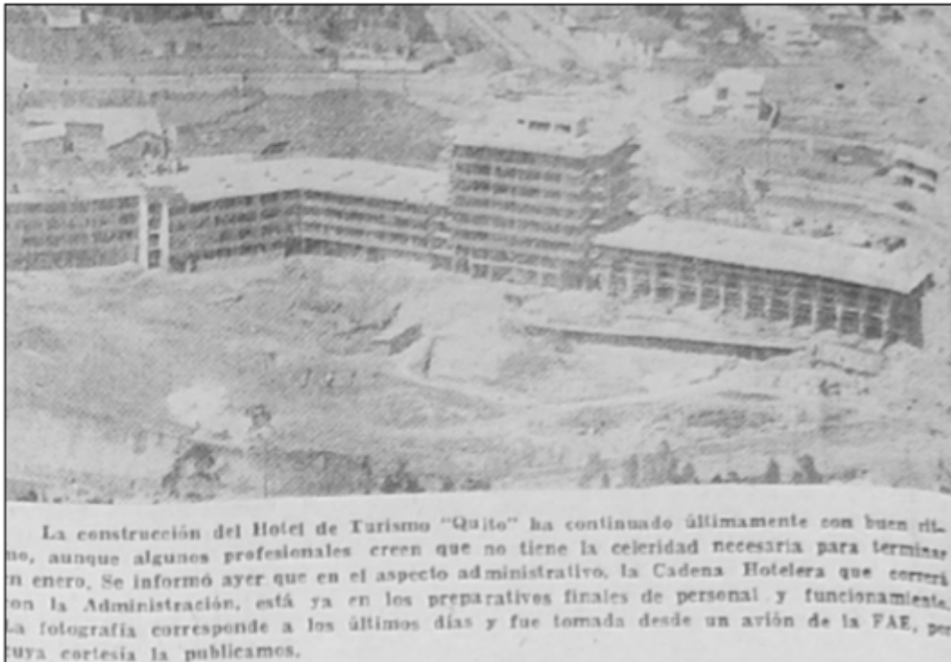
Fotografía 2.- Construcción del Hotel de Turismo "Quito"

Las Fotografías 1 y 2 corresponden a 1959, año en el que el "Hotel Quito" se encontraba en construcción. En ambas imágenes, capturadas desde distinto ángulo, se puede observar el Bloque Sur, con lo que se evidencia que este elemento, pertenece a la misma temporalidad constructiva del resto de bloques, sin embargo según lo señala el INPC "no forma parte del bien patrimonial"; afirmación que nos lleva a realizar la presente consulta, respecto a la diferencia entre el Bloque Sur, y los elementos considerados inmuebles patrimoniales en el inventario que consta en el sistema SIPCE con código IBI-17-01-12-000-000001.