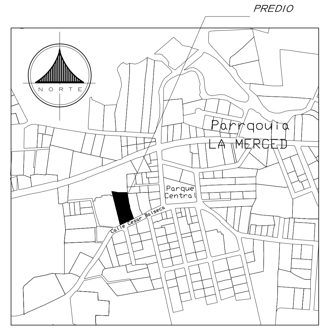
UBICACIÓN ESCALA 1:5.000