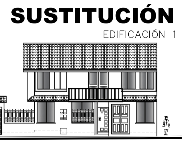
FACHADA FRONTAL SUR CALLE CESAR BALSECA ESCALA 1:200

CERRAMIENTO APLICACIÓN DEL ESTANDAR CERRAMIENTO SEMI - TRANSPARENTE SEGUN ESPECIFICACIONES TÉCNICAS