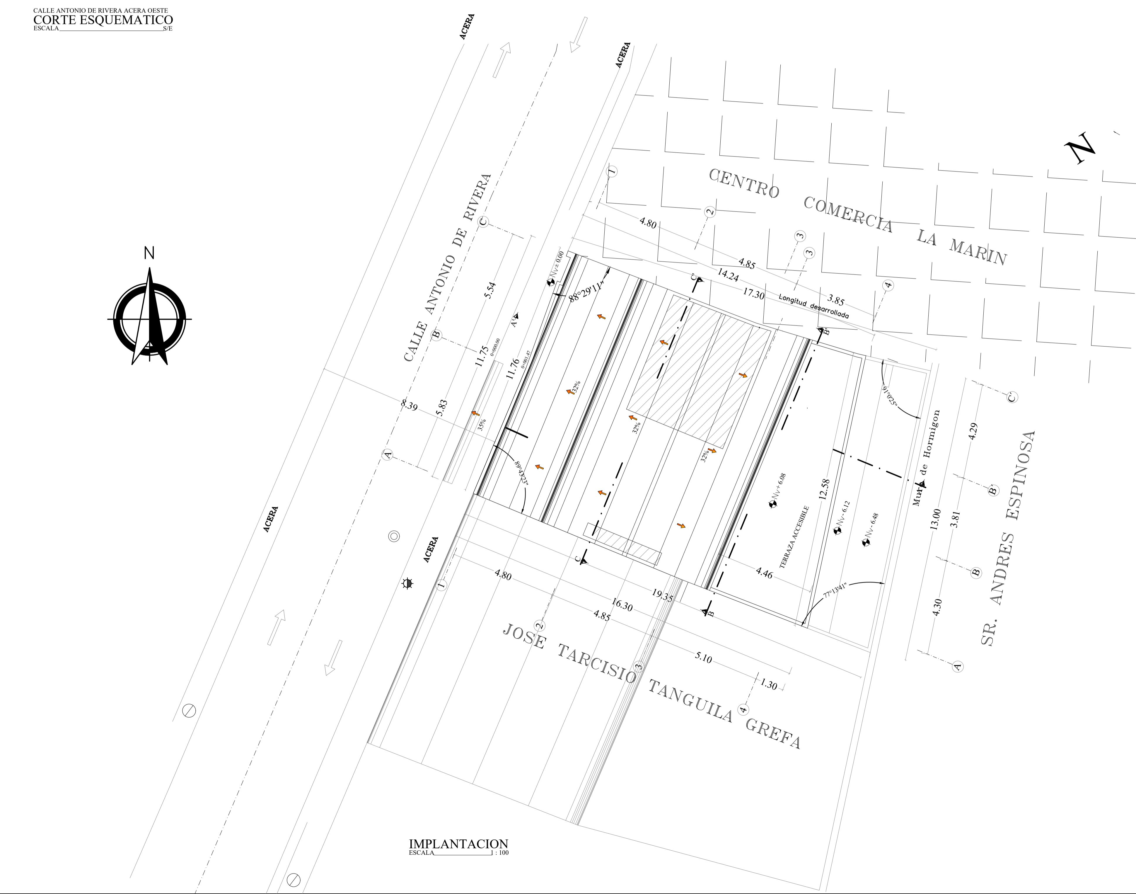
IMPLANTACION ESCALA 1:100