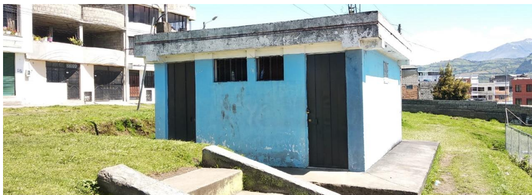
Fotografía 3: Baterías Sanitarias