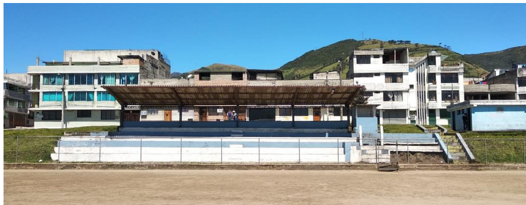
Fotografía 2: Graderio