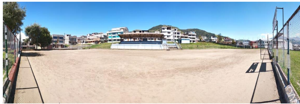
Fotografía 1: Cancha de microfútbol (cerramiento de malla)